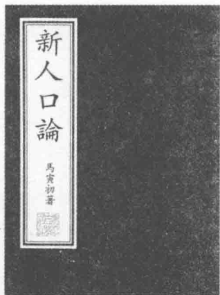
◎马寅初著作《新人口论》