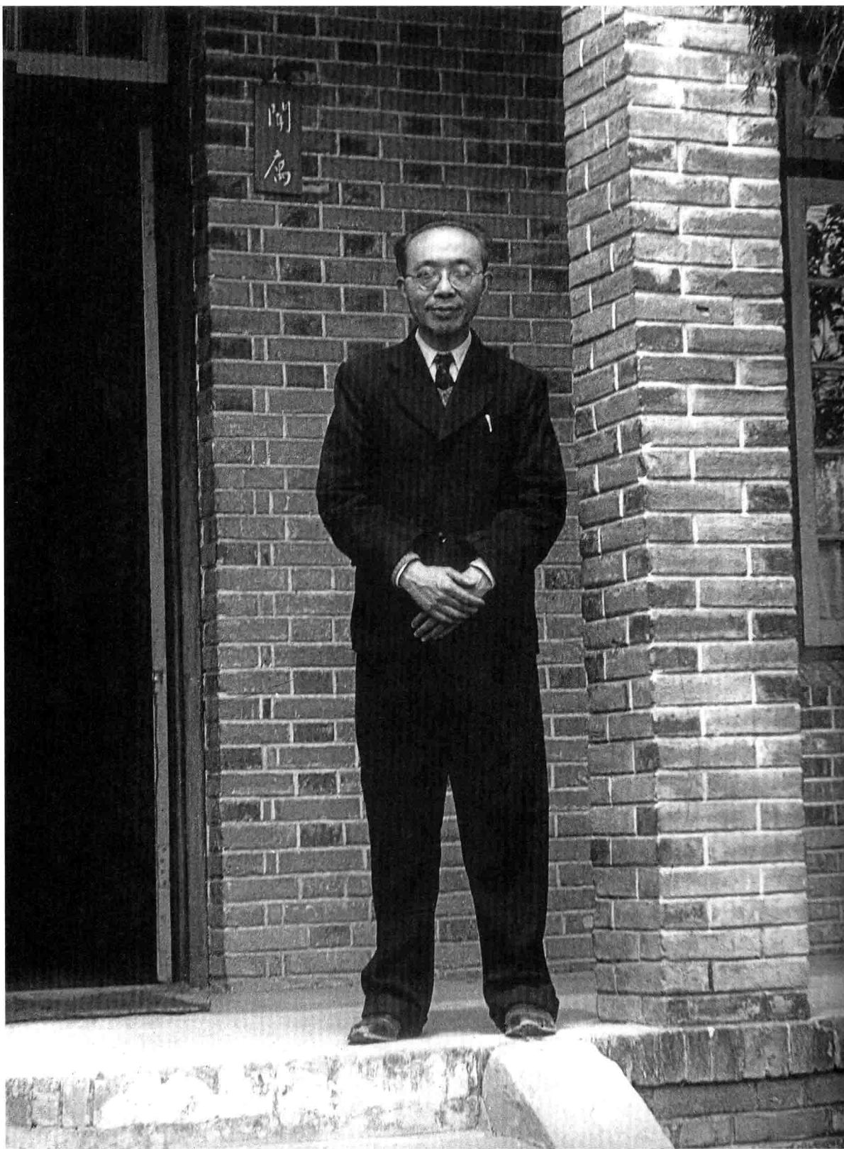
聞宥先生在住家門前留影