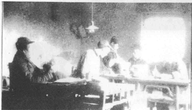
报社编辑部的同志正在紧张地编稿。