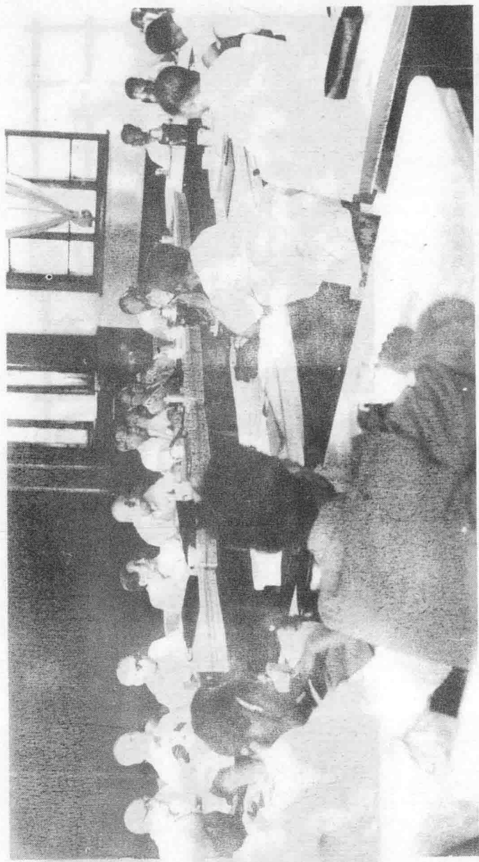
太岳新闻史座谈会于1985年7月5日至8日在太原召开。图为大会会场一