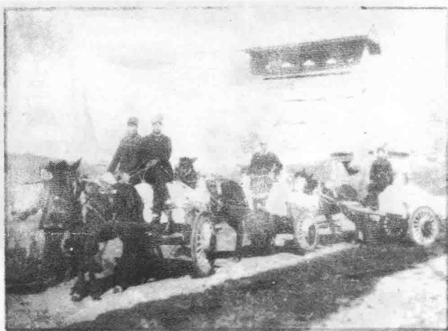
报纸和书籍出版后,组织力量运送到太岳新华书店各分店和支店。