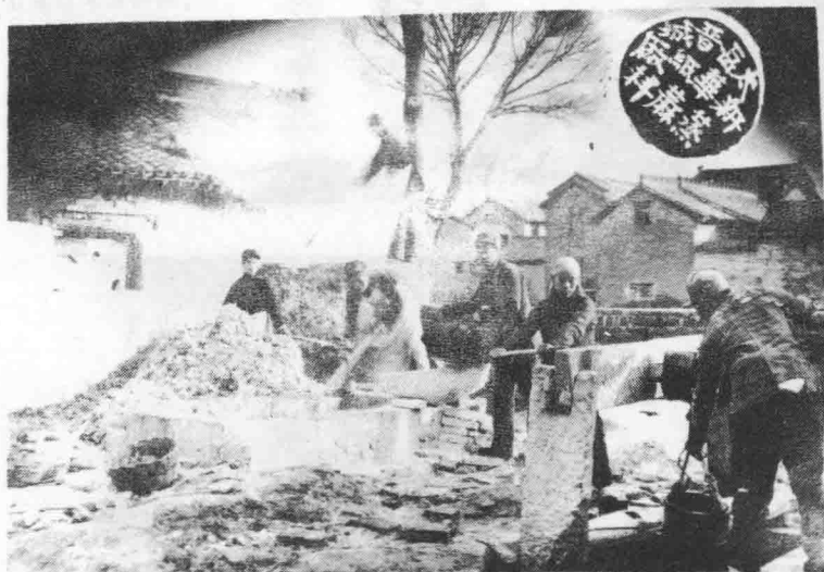
太岳晋城新华纸厂正在蒸麻杆。