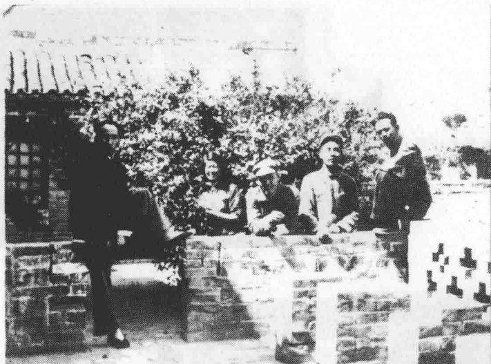
1949年春,太岳日报全体领导同志合影。