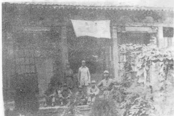
在阳城汗上村的印刷厂,工人们正在拣字。