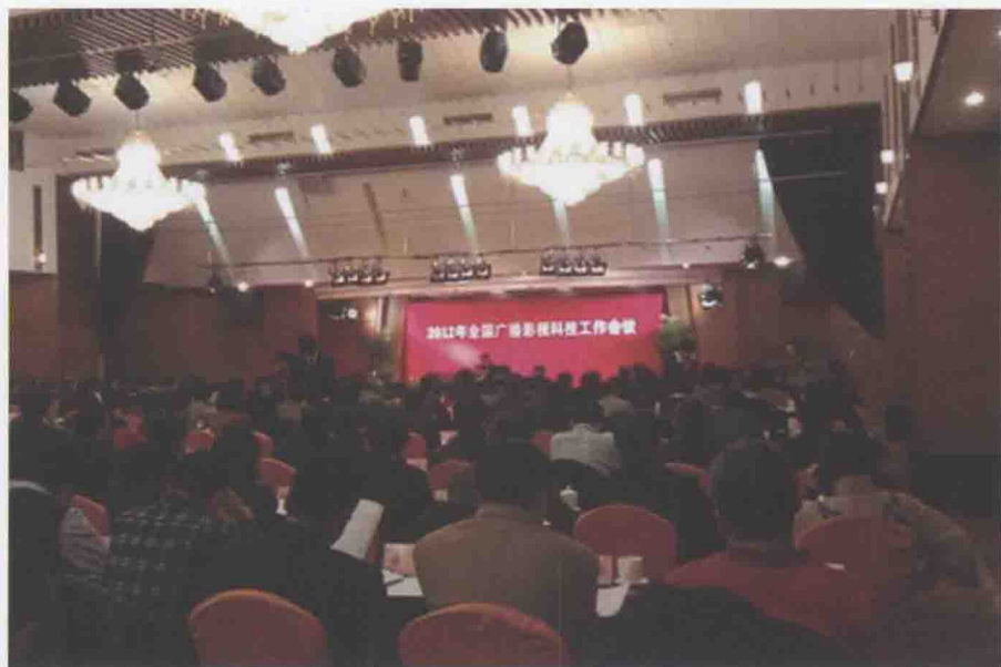
2012年2月14日，2012年全国广播影视科技工作会议召开。

四是国产纪录片实现快速发展。实行优秀国产纪录片季度推优制度。全年向全国推荐播映156部优秀作品。重新制定了《优秀国产纪录片及创作人才扶持项目评审办法》，评选出2011-2012年度优秀导演、编剧、短片、中片、长片、栏目、播出机构、制作机构、组织机构共9类48个项目。开展迎接十八大纪录片展播。从近年的国产纪录片中选取了《科学发展铸辉煌》等15部优秀作品，在全国各级电视台播出。进一步完善纪录片产业布局。2012年全