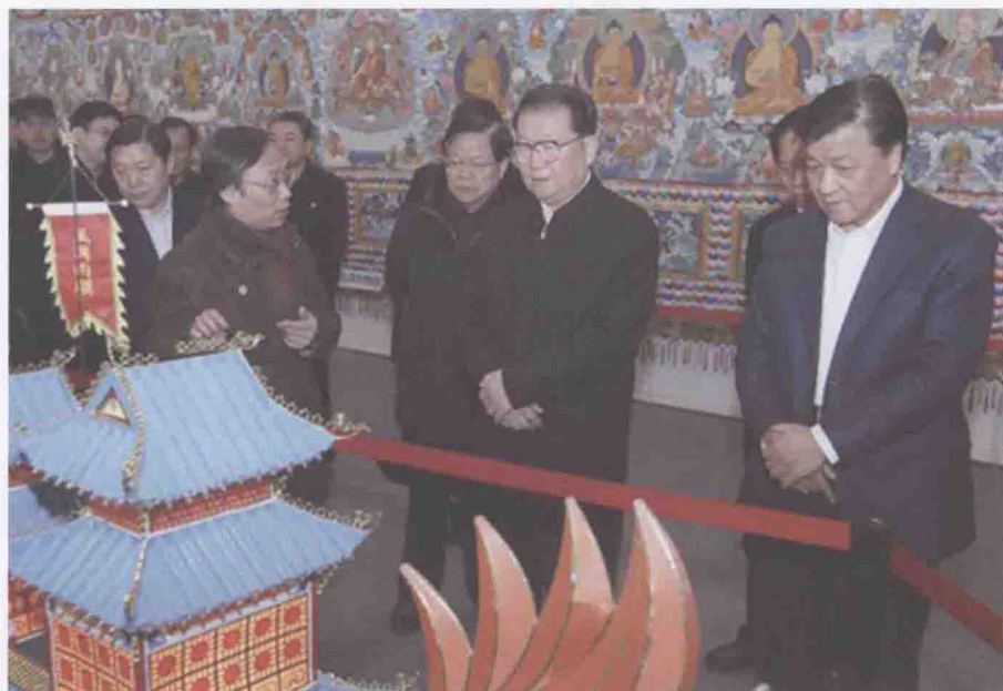
2012年2月14日，时任中共中央政治局常委李长春来到北京全国农业展览馆新馆，参观中国非物质文化遗产生产性保护成果大展。