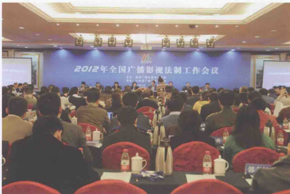
2012年3月27日至28日，2012年全国广播影视法制工作会议在太原召开。

一是有线网络数字化双向化改造和整合迈上新台阶。全国 2.1 亿有线电视用户已有 1.3 亿实现数字化，其中双向覆盖用户近 7000 万、实际开通用户 1900 万。一省一网目标基本实现。国务院正式批准了中国广播电视网络有限公司组建方案。二是新媒体新业态发展加快。全国高清和高标清同播的电视频道已达 28 个。3D 试验频道顺利试播。互联网视听节目服务稳步发展，移动多媒体广播电视覆盖扩大、用户增加。三是三网融合试点取得积极进展。工信部和总局分别批复同意电信、广电企业在第一批 12 个试点地区开展三网融合业务。IPTV 集成播控总平台、分平台