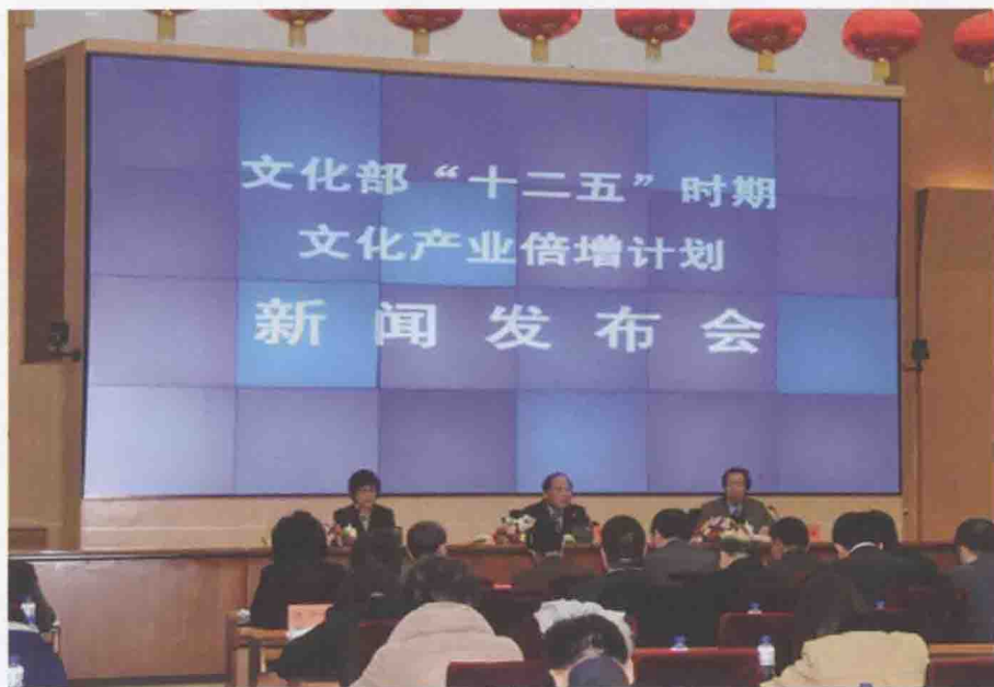
2012年2月28日，文化部在北京召开新闻发布会，正式向社会发布《文化部“十二五”时期文化产业倍增计划》。

《“十二五”时期国家动漫产业发展规划》是我国动漫产业首部单列规划。《规划》明确了“十二五”时期我国动漫产业的发展任务：原创动漫创意、研发、制作能力大幅提升，动漫精品力作不断涌现，技术创新能力持续增强，国际竞争力大大提高，发挥市场机制对动漫文化资源配置的积极作用，着力打造5至10个知名国产动漫品牌和骨干