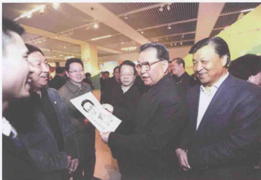
2012年3月16日，时任中共中央政治局常委李长春来到中国国家博物馆，参观正在这里举行的党的十七大以来中国动漫产业发展成果展。