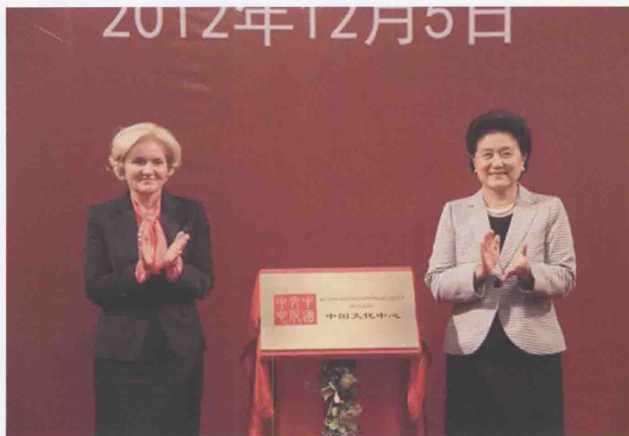
2012年12月5日，莫斯科中国文化中心揭牌仪式举行，国务委员刘延东、俄罗斯副总理戈洛杰茨共同出席。