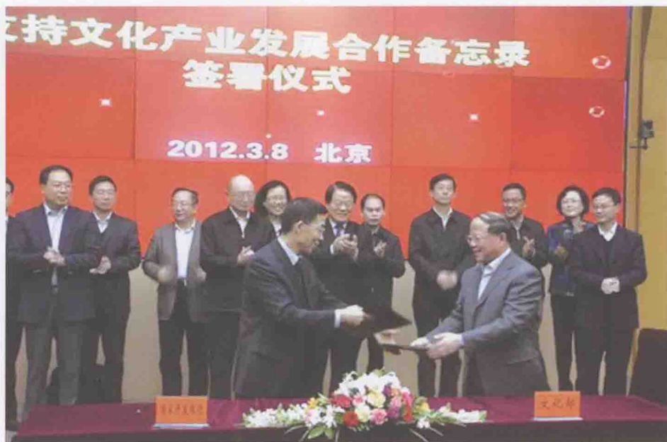
2012年3月8日，文化部与国家开发银行在北京签署《支持文化产业发展合作备忘录》，共同推动文化产业成为国民经济支柱性产业，促进社会主义文化大发展大繁荣。

进一步强化对基地、园区的动态管理，撤销北京中录同方文化传播有限公司等4家存在突出问题、不再发挥示范作用的单位国家文化产业示范基地的命名。积极反映文化部门对主题公园建设的监管意见，配合国家发改委制定《关于规范主题公园建设的意见》，加强主题公园建设管理。为进一步培育骨干文化企业，发挥国家级文化产业基地园区示范引领作用，开展第五批国家文化产业示范基地和第四批国家级文化产业示范（试验）园区的命名工作，举办国家级文化产业园区基地命名授牌会议和发展座谈会。启动《国家文化产业示范基地评选命名管理办法》修订工作。