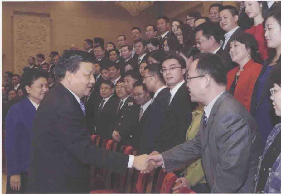
2012年11月7日，第二十三届中国新闻奖颁奖报告会在北京举行。中共中央政治局常委、中央书记处书记刘云山会见获奖代表，向获奖代表表示祝贺，向全国新闻工作者致以节日问候。