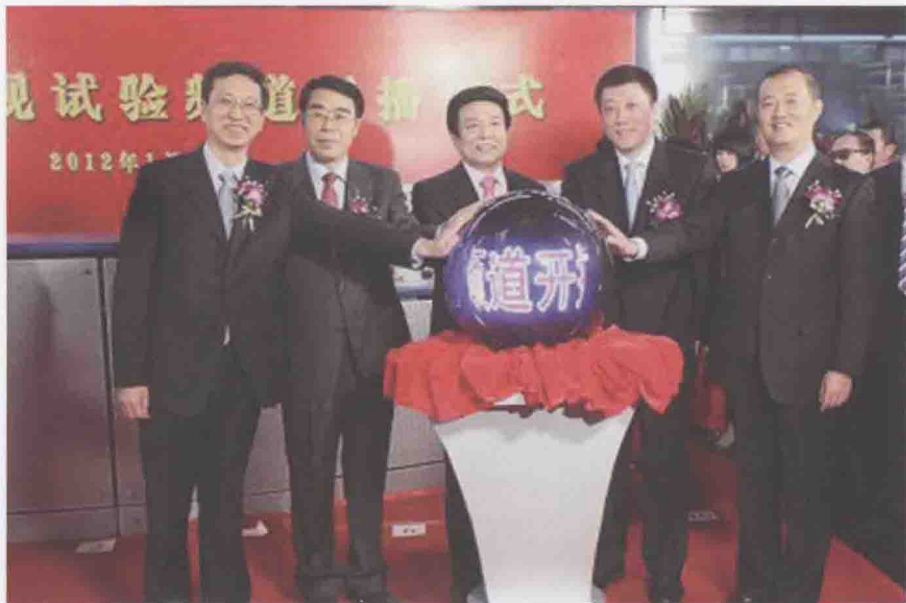
2012年1月1日，我国首个3D电视试验频道开播仪式在中央电视台举行，中宣部副部长、广电总局党组书记、局长蔡赴朝，党组副书记、副局长张海涛，党组成员、副局长田进、李伟，党组成员、中央电视台台长胡占凡出席并共同启动开播按钮。

一是以强大声势报道十八大，各级广播电视媒体发挥了主阵地主力军作用。中央三台共现场直播19场（含音视频、图文直播），首播十八大新闻近2万条，开办十八大专题专栏3千余个。省级电台电视台推出专题专栏和系列报道节目300多个，制作播出近百部理论文献专题节目，结合“科学发展成就辉煌”主题宣传，深化“走转改”活动，推出一大批接地气、受欢迎的新节目、好报道。二是以创新创优节目迎接十八大。加强节目宏观调控，黄金时间综艺娱乐类节目减少三分之二，新闻类节目增加三分之一，科教、文化、纪录片、道德建设类节目大幅增加，推出100多个导向正确、深受欢迎的新栏目。三是影视精品献礼十八大。组织创作、展播展映一批优秀献礼电影、电视剧、纪录片和重大理论文献片，展示了文化改革发展成果，丰富了人民精神文化生活，为十八大营造了热烈祥和的文化氛围。