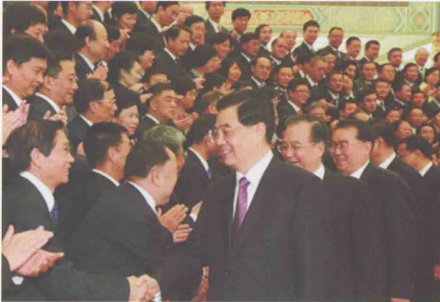
2012年9月26日，全国文化体制改革工作表彰大会在北京人民大会堂举行。会前，时任中共中央总书记、国家主席、中央军委主席胡锦涛亲切会见全体与会代表。