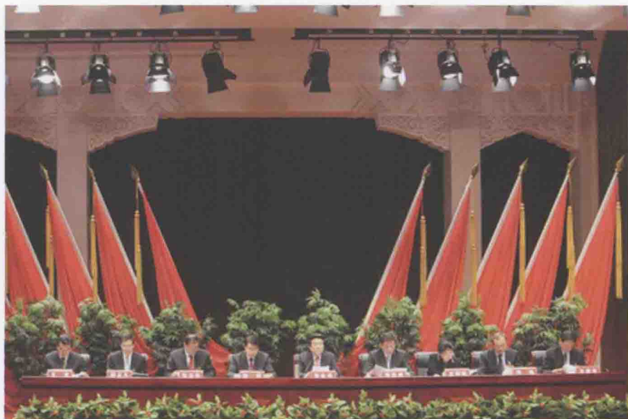
2012年1月4日至5日，全国广播影视工作会议在北京召开。

一是电视剧整体品质稳步提升，创作播出进入追求品质、以质取胜阶段。现实题材作品继续占据主导地位，表现当代中国现实风貌和时代主流精神的作品占半数以上。如改革开放题材的《温州一家人》，先进人物题材的《焦