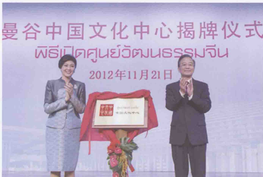
2012年11月21日，时任国务院总理温家宝与泰国总理英拉在曼谷共同出席曼谷中国文化中心揭牌仪式。