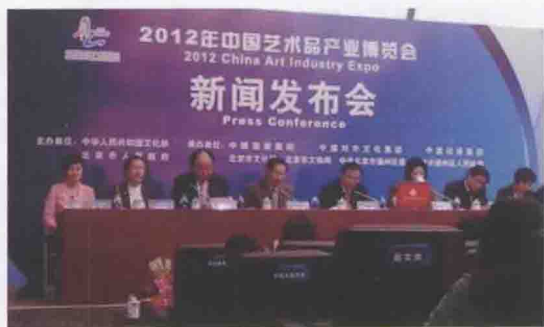
2012 年 9 月 26 日，由文化部和北京市人民政府共同主办的 2012 中国艺术品产业博览会在北京开幕。

为更好总结发展经验，扩大产业影响，于 2012 年年初举办“十七大”以来中国动漫产业发展成果展。为进一步加强总体协调和部门协作，召开扶持动漫产业发展部际联席会议。协调财政、税务等部门，继续开展动漫企业认定工作，全年认定动漫企业共 110 家。启动实施“2012 年国家动漫品牌建设和保护计划”，该计划主要培育和扶持民族原创优秀动漫创意、动漫品牌，经业界专家严格评选，共确定《喜羊羊与灰太狼》等 20 个动漫品牌项目和《长歌行》等 30 个动漫创意项目入选，涵盖了动漫产业多个领域。“国家动漫品牌建设和保护计划”坚持资金扶持和公共服务相结合，通过为入选项目提供一定的资金扶持，搭建产业化推广平台，加强对入选项目的知识产权保护等手段，引导培育一批具有市场化、产业化、品牌化开发价值的民族原创动漫创意，推动建设一批在国内和国际市场具有一