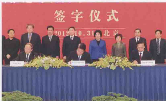
2012 年 10 月 31 日，文化部、国家文物局在北京与福建省人民政府共同签订进一步加快推进海峡西岸经济区文化发展合作协议，文化部部长蔡武出席仪式。