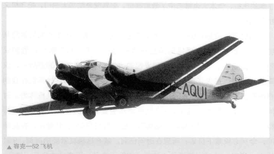
▲ 容克—52 飞机