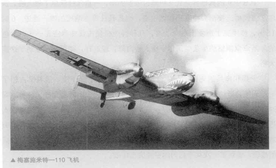
▲ 梅塞施米特—110 飞机

第二攻击波正按原命令，与第一攻击波间隔20分钟朝着福内布机场飞去，上面乘坐的是第324步兵团第2营的官兵。当伞兵不能按预定计划降落的时候，盖斯勒中将接到戈林发来的一道严厉的命令，命令他立即召回后几批攻击部队。然而，第二攻击波的指挥官瓦格纳上尉虽然接到了返航命令，但他没有执行。他们的运气还真不错，奥斯陆附近天气晴朗，能见度良好。容克式飞机的前导机组已经到达福内布上空。瓦格纳向下观察着盘旋了一周。这是一个石山环抱的小型机场，有两条混凝土跑道，坡度较大，跑道终点与水相连。瓦格纳向机长们发出了着陆信号，容克式飞机以小半径盘旋进场着陆。在瓦格纳的飞机进场着陆时，守卫机场的挪威军队的猛烈火力击中