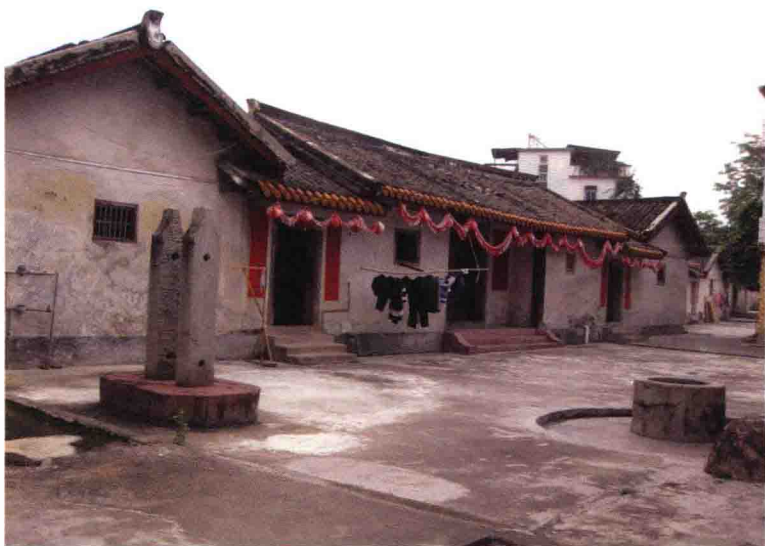
城东三坑口张氏私塾西农望岁居书屋

建于道光十四年（1834）。曾在该私塾读书、居住过的名人有光绪二十七年（1901）辛丑恩正科举人、福建长汀县令张衡皋，宣统二年（1910）进士、驻日本神户领事、曾资助过孙中山革命的张淑皋，著名化学家张资珙等。