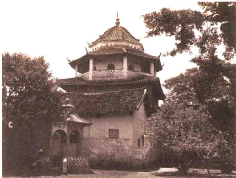
元城书院旧址