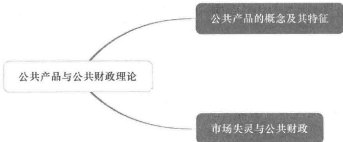
图1-2 公共产品与公共财政理论

现代市场经济理论通常将财政称为公共财政或公共部分经济、公共经济。公共财政的理论基础是“公共产品”和“市场失灵”理论。西方国家通常把经济部门分为私人部门和公共部门两部分,其中,私人部门提供的产品称为私人产品,公共部门提供的产品称为公共产品。