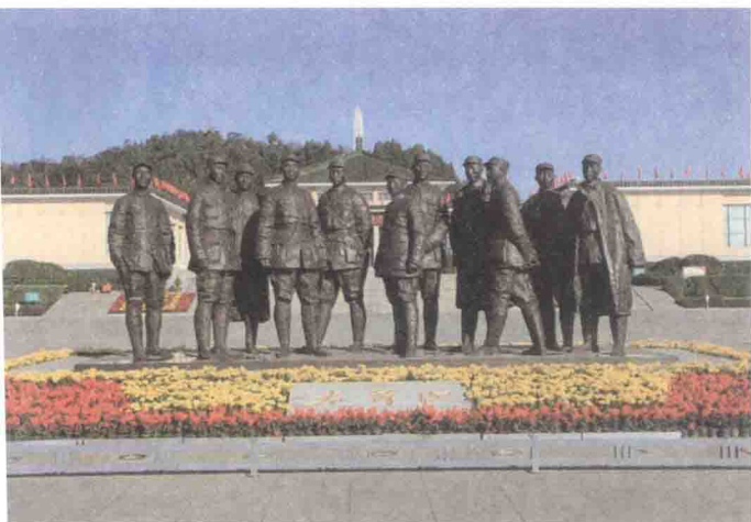
武乡县八路军纪念馆

梦村时候，想起爷爷说的吕洞宾——这个道者似乎有点好色，有关于他的传说也非常旖旎有趣——我想这个仙人是快乐的，至少少了其他仙者所刻意谨守的所谓规矩——性格和我自己有点相像。除此之外，在邯郸，当然还有太极拳一代宗师杨露禅，他好像是永年人，将身体的极限发挥到极致——重点在于独创和创新，杨露禅的这一点，是最令人尊敬和羡慕的了。