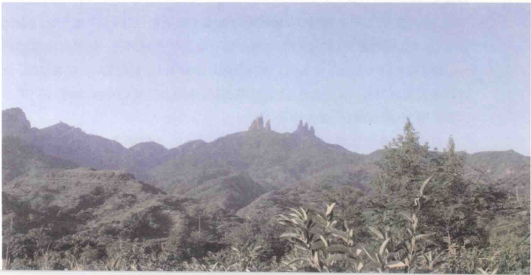
南太行山区奇峻的山峰

其中几个街道很是熟悉，虽然不是很长，但在我心中，它似乎就是所有城市的街道的模样了。其中一条路叫京广路，多次听说，那条路上几乎每天都有事故发生，都有人在车轮下丧生。后来去的时候，母亲一再交待我，没事千万不要去京广路溜达啊！还有一条是太行街，东西走向，里面有市委、市政府、电影院、新华书店和邮局。在附近中学读书的时候，我还和几个同学到那里的电影院看过几次电影，都是港片。一个人到新华书店看书，去邮局寄东西。