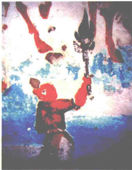
敦煌壁画中举火把的人