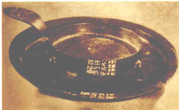
有“铜拈锭”铭文的西汉三足铜拈灯

等铜灯，在灯盏的中心都有烛钎，但并未自铭“锭”；而在灯盏中没有置烛钎的拈灯却自铭为“拈锭”。徐铉对“锭”与“锭”的注释不足取。另外一种意见认为，“锭”与“锭”的区别是在于灯有无足，有足的灯曰锭，无足的灯曰锭。这一说法也与实际情况不相符。