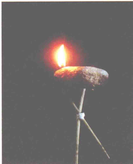
最原始的灯具——石头上挖一个坑，放一点油脂，然后点火