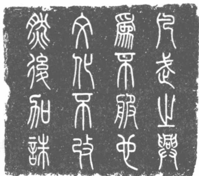
图 1—1 “凡武之兴, 为不服也; 文化不改, 然后加诛”篆书书影

“Culture” 的原初概念在亚洲的传播译介以日本为早, 他们选择汉字“文化”对译各类西文中的“culture”, 意指不动用权力或刑罚, 而是依靠文德进行教化。日本的一些著名辞典明确标示“文化”一词来自中国古典文献多处: 如《易经·贲卦》的“观乎天文以察时变, 观乎人文以化成天下”; 如西汉刘向的《说苑·指武》的“凡武之兴, 为不服也; 文化不改, 然后加诛”(见图 1—1); 如《后汉书·荀悦传》的“宣文教以章其化, 立武备以秉其威”。 ③ 显然, 汉语“文化”这一术语带有类学启蒙(enlightenment)、觉悟和日后濡化(enculturation)的精神意义和教化方式的意义。到了 19 世纪和 20 世纪初, “culture” 成了人类学最核心的概念, 它的复合含义更为复杂起来。 ④ 然而, 即使到了最近 100 年经历了人类学丰富理论洗礼的今天, 汉字“文化”的含义也在相应发生转换。正是围绕着“文化”这一重要术语, 历代人类学家以不同的理论与观察视角, 创造和积累了“文化”数以百计的著名定义, 以利于人们对文化内涵的理解。