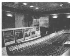
图 1-3: 现代录音棚

近百年来,音乐的发展进入了全新的发展阶段。利用音像载体、电视、电影甚至是网络技术扩音、录音,使得音乐这种时间的艺术得以保存。音乐创作也随之进入了一个崭新的时期。20世纪之后,许多音乐的“第一存在”方式不再是在作曲家的乐谱纸上,传统的乐队的演出活动中,而是存在于电子信息形态之中。但我们仍须谨记,任何一部音乐及其价值,并不存在于乐谱和现代的数据光盘中,而是存在于“表演的过程”中。现代技术让我们能任意在音乐中遨游,但中世纪音乐的肃穆与克制,现代音乐的狂放与躁动,仍然与当时的文化息息相关。我们学习西方音乐史,应该在时空的舞台上领略音乐与文化的共舞,感受音乐与文化的不懈之缘。