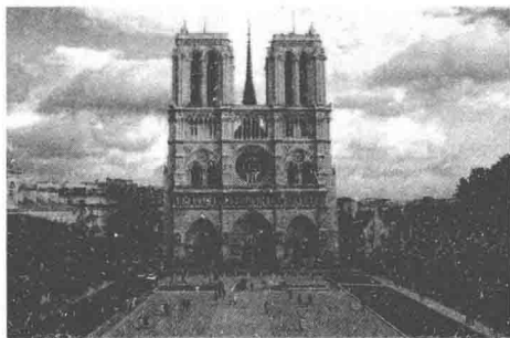
图 1-1: 巴黎圣母院,是一座典型的哥特式风格教堂,古老巴黎的象征,是历史上最为辉煌的建筑之一。12 世纪末起,在这座大教堂和周围的大学中产生了一种复调音乐的传统,影响长达一百多年,被称为巴黎圣母院复调。

基督教文化是西方文化的核心之一,它对音乐的影响是巨大、甚至是决定性的。基督教会是音乐活动的官方机构,教会思想居于统治地位。当时的教会对音乐采取了严格限制的态度。然而也正因如此,音乐家有了大量的创作作品,大量音乐文献和音乐作品得以完整保留,中世纪音乐的历史进程得以延续上千年。