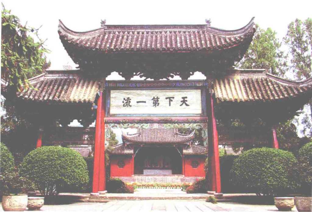
▲ 陕西勉县武侯祠牌楼