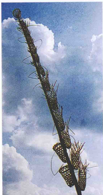
装牺牲的鸡笼“乌拥”