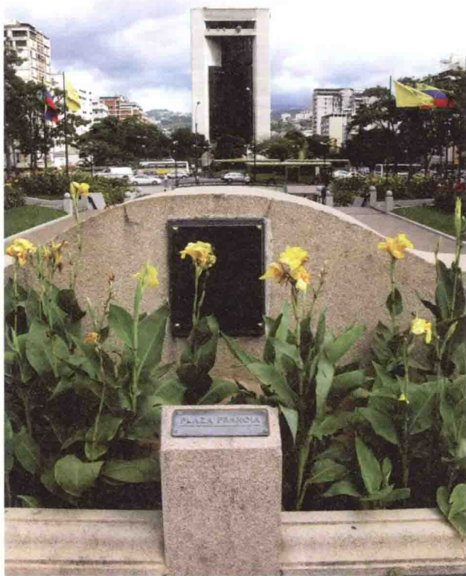
加拉加斯法兰西广场