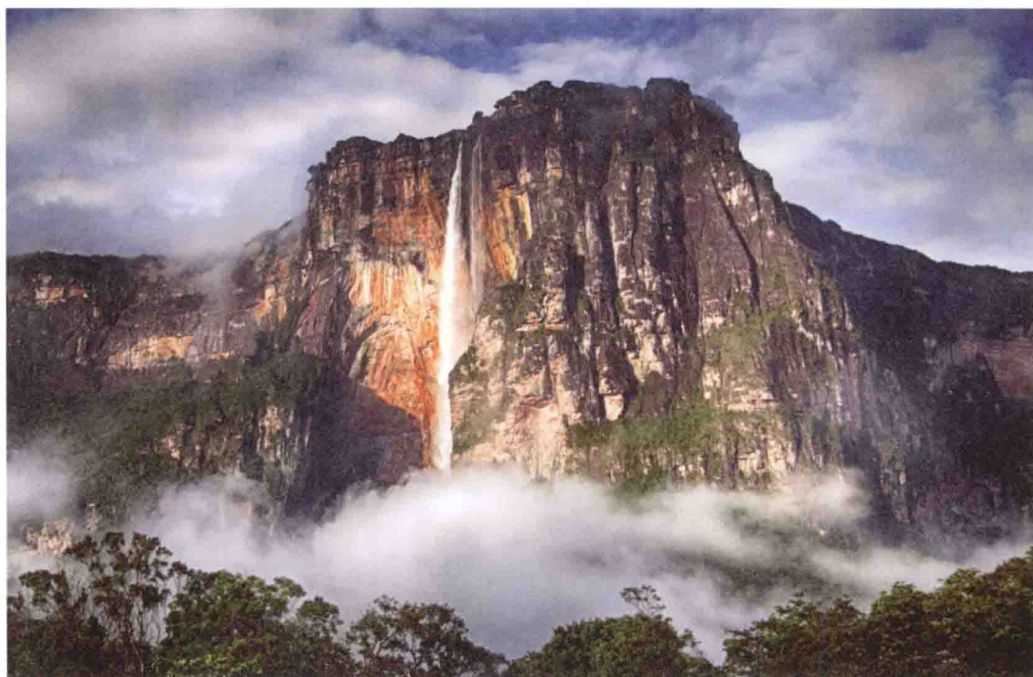
世界上落差最大的瀑布——安赫尔瀑布