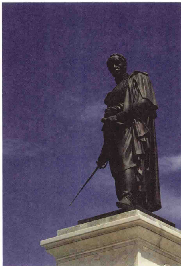
西蒙·玻利瓦尔塑像