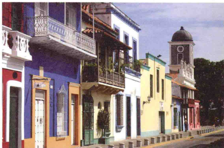
卡贝略玻利瓦尔大街