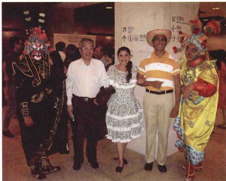
2014年6月28日 委内瑞拉艺术团演员 与中国演员及作者（左 二）合影