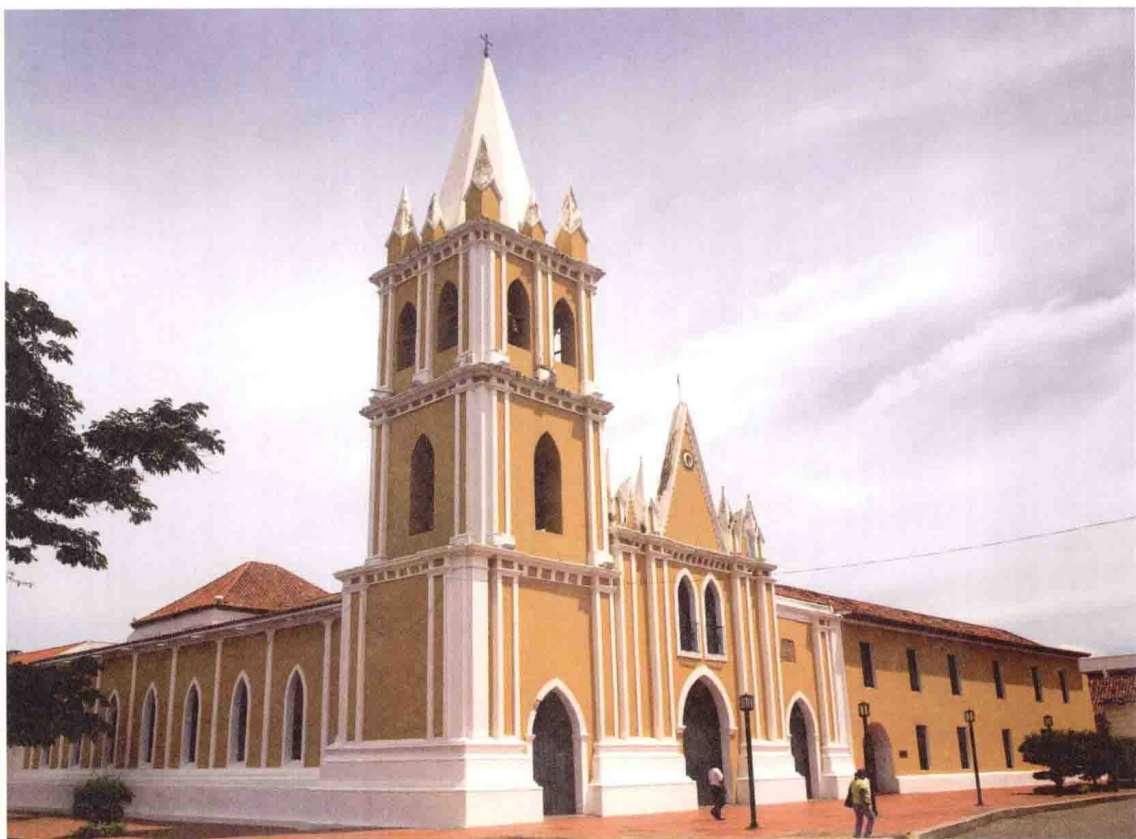
科罗圣弗朗西斯科教堂