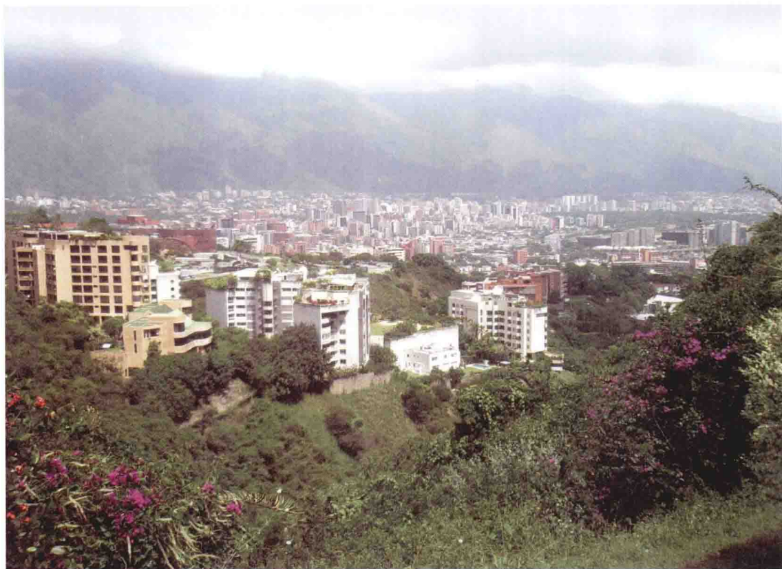
加拉加斯全景