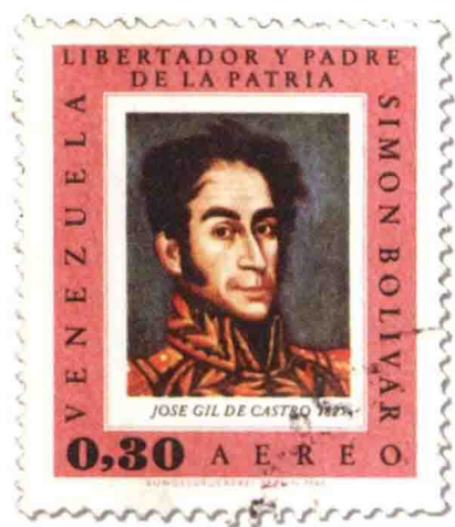
纪念西蒙·玻利瓦尔的邮票