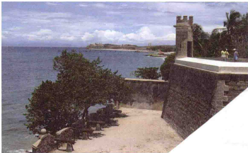
玛格丽塔岛上的古炮台