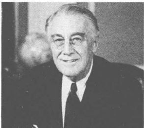
罗斯福 | Franklin Roosevelt