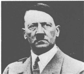
希特勒 | Adolf Hitler

一有合适的时机就进攻波兰……我们不能期望重演捷克事件。这次得打仗了，我们的任务是孤立波兰。