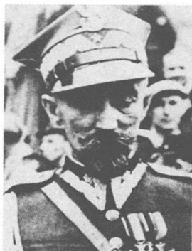
斯米格威·雷兹 | Smigly · Rydz

波兰陆军元帅。第一次世界大战期间，在毕苏茨基领导的波兰军团中任旅长，与俄国军队作战。1918年代表“波兰军事组织”参加临时政府。波兰独立后任国防部长，武装部队总监、总司令。1920年率部进攻苏俄，一度占领基辅。1926年5月，参与毕苏茨基发动的军事政变。1935年，成为波兰事实上的独裁者。1939年德波战争爆发时，任波军总司令。