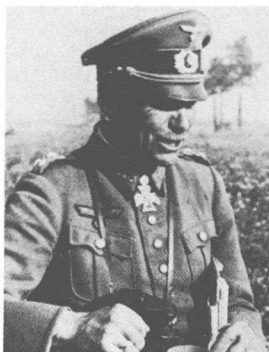
古德里安 | Heinz Guderian

德国陆军上将。1934年创建德国装甲师并任师长，1938年任军长。1939年至1940年对波兰和法国作战。1941年任第2装甲集团军司令，参加对苏战争，同年年底因在莫斯科郊区战败被解职，编入预备军。1943年2月任装甲兵总监，7月任陆军参谋长。1945年3月因作战失利再次被解职。后被美军俘获。