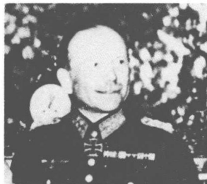
古德里安 | Heinz Guderian

波兰再一次遭到了两个大国的侵略。这两个大国曾经同其他大国一起奴役波兰达 150 年之久，但却不能摧毁波兰民族的精神。华沙的英勇抵抗，表明波兰的灵魂是不可毁灭的。