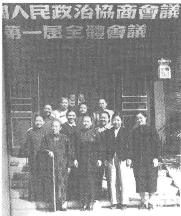
出席中國人民政治協商會議第一屆全體會議的部分女代表合影。前排左起：何香凝、宋慶齡、鄧穎超、史良；二排左起：羅叔章、蔡暢、丁玲；後排左起：李德全、許廣平、張曉梅、曾憲植。