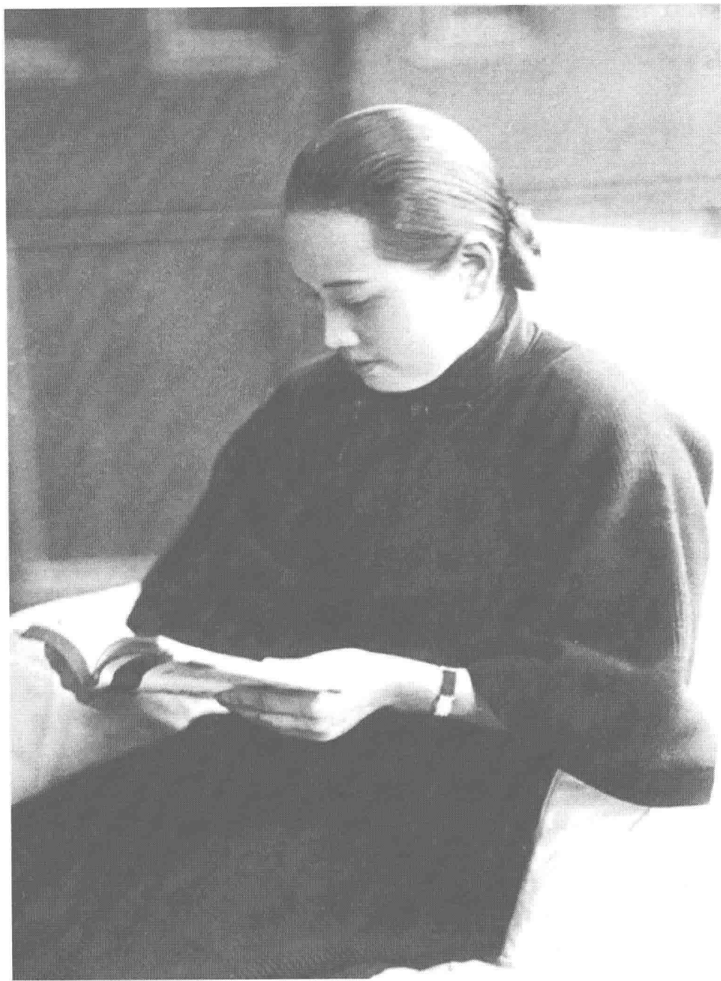
一九二七年，攝於武漢。