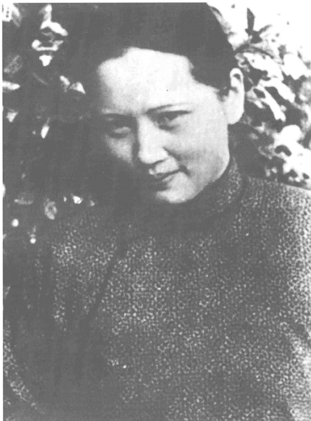
一九三四年，攝於上海。