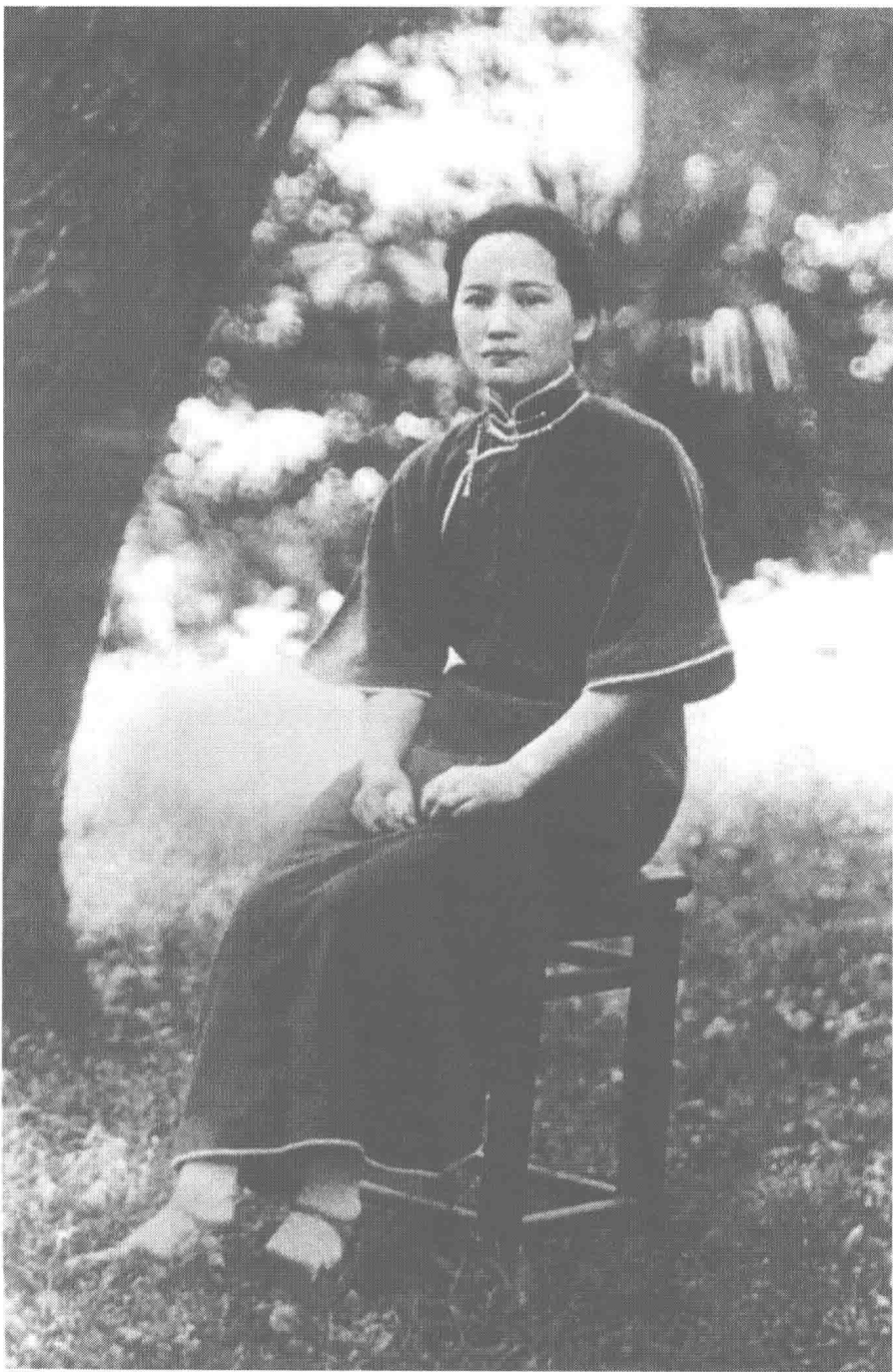
一九二五年四月十一日，宋慶齡回到上海。圖為宋慶齡在上海莫里哀路寓所留影。