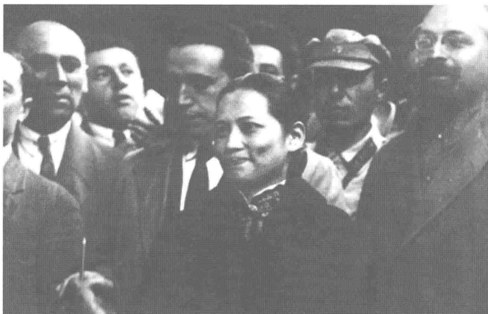
一九二七年八月，抵莫斯科時的宋慶齡。