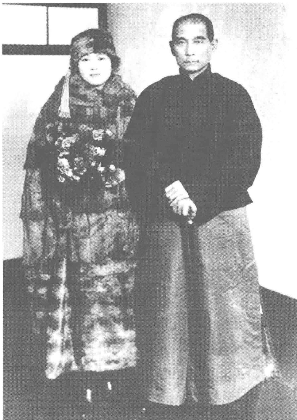
一九二四年十一月二十四日，孫中山與宋慶齡在日本神戶合影。