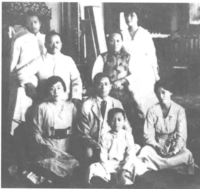
宋慶齡（前排右一）一家。

學生時代的宋慶齡，她七歲進入上海中西女塾讀書，所用的英文名為 Rosamond。宋慶齡從小學習勤奮，性格嫻靜而好思考，特別喜愛學習英語與文藝，她參加中西女塾的話劇排演，很得老師和親友的讚賞。