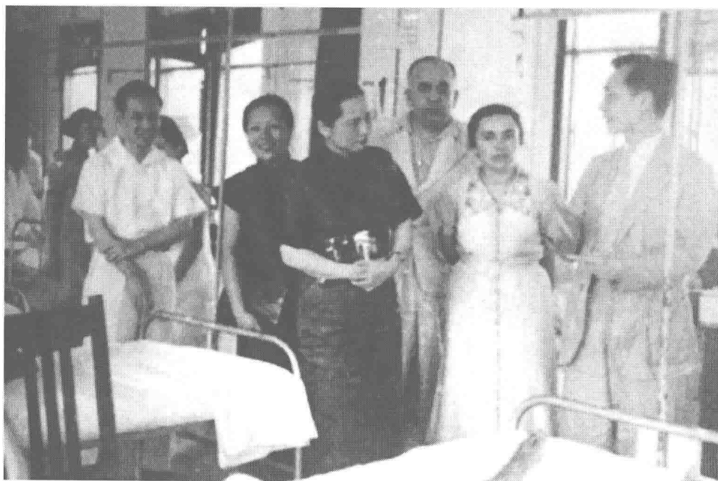
1938年，宋慶齡在廣州視察傷兵醫院。