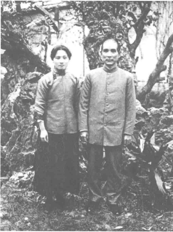
一九一七年七月， 攝於大元帥府。