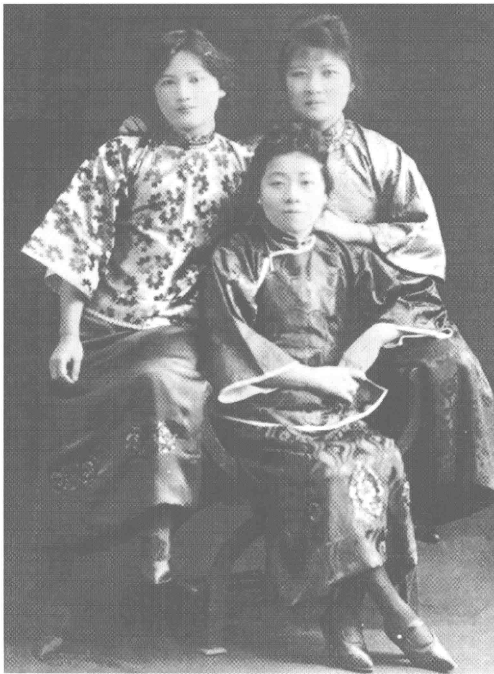
在衛斯理安女子學院學習時的宋慶齡、宋藹齡（中）、宋美齡（右）。