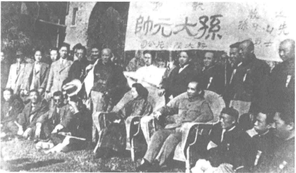
一九二四年十一月，孫中山應馮玉祥邀請，北上共商國事，宋慶齡陪同北上。 十七日到達上海，受到各界熱烈歡迎。