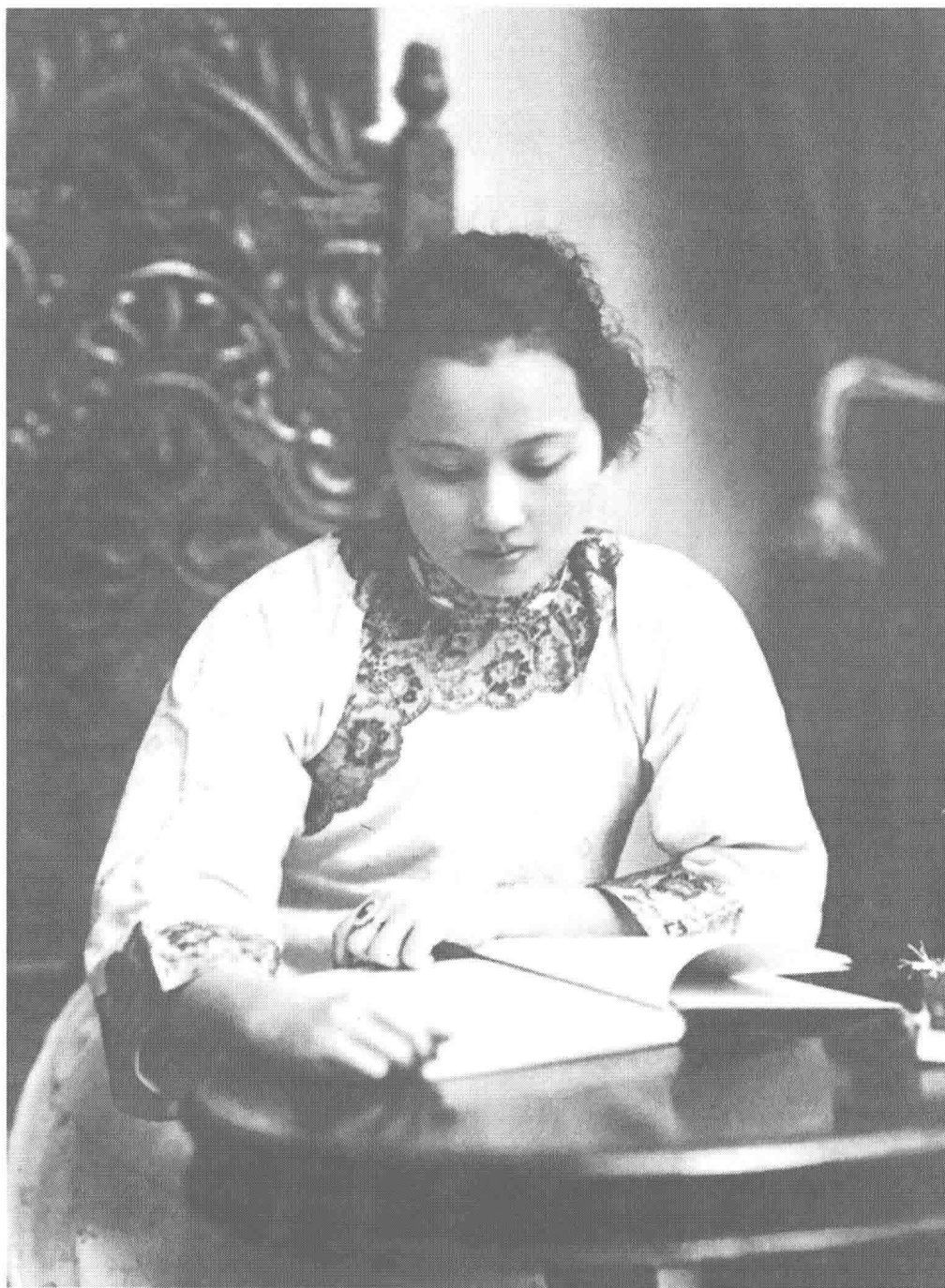
一九二〇年，攝於上海。