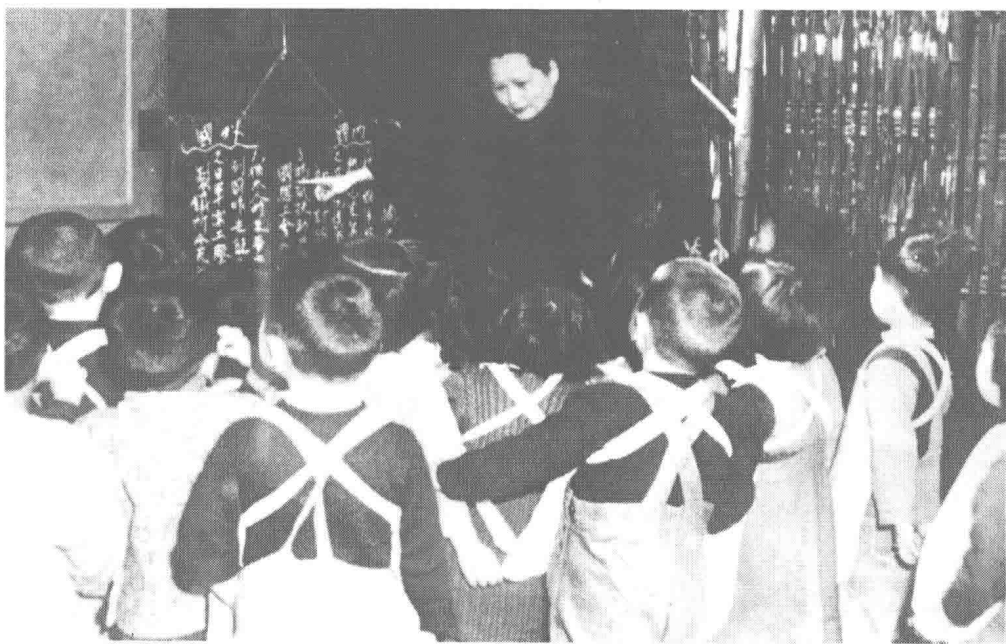
宋慶齡看望中國福利基金會兒童福利站識字班的孩子。