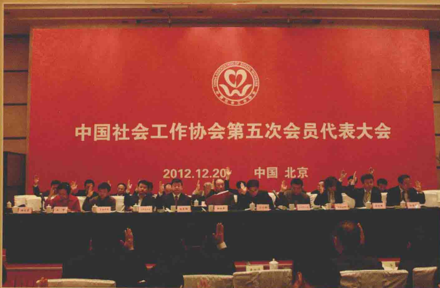
■ 2012年12月20日，中国社会工作协会第五次会员代表大会在北京举行。会议听取和审议通过了《中国社会工作协会第四届理事会工作报告》，并选举产生了中国社会工作协会第五届理事会理事和常务理事。