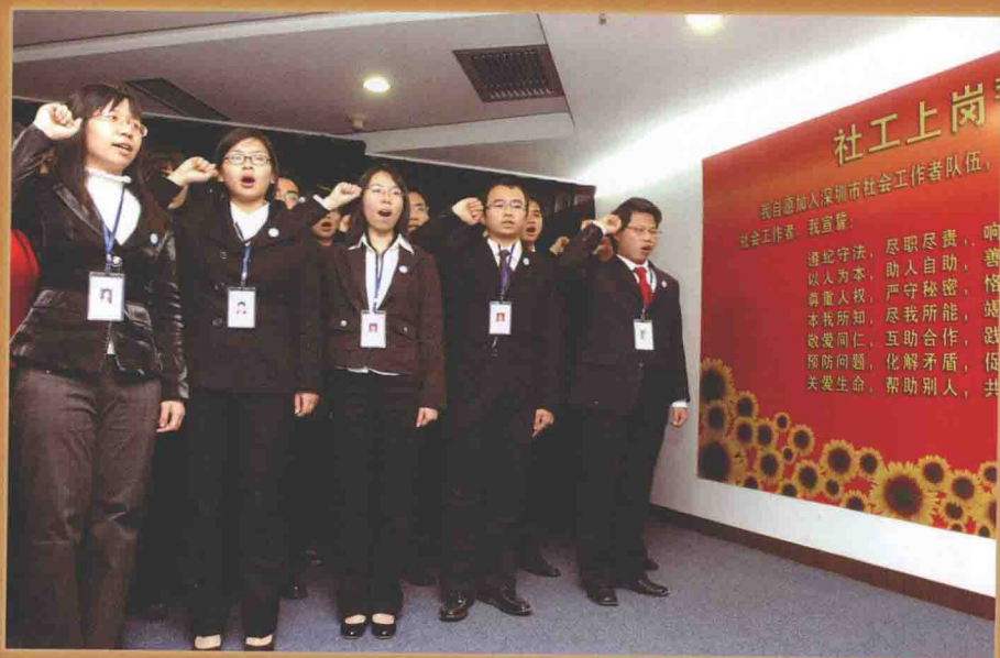
■ 深圳注重建设专业化、职业化的社工队伍，目前已初具规模。截至2012年12月，深圳社工行业从业人员达3035人，其中专业社工2761人。图为深圳社工宣誓上岗，遵守社工服务守则，竭诚为深圳市民服务。