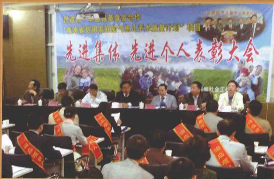
■ 青海省社工协会着力开展专业社会工作项目，服务西部贫困家庭疝气患儿。图为2011年5月20日，青海省社会工作协会召开“西部贫困家庭疝气儿童手术康复计划”项目表彰大会，对在项目实施过程中成绩突出的集体和个人给予表彰和奖励。