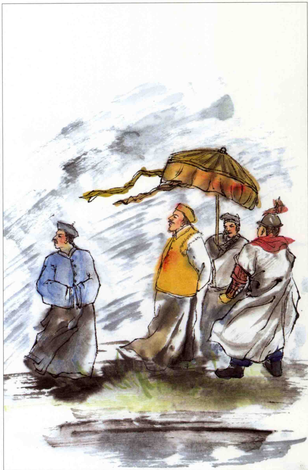
努尔哈赤迁都洛阳