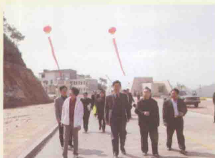
国家旅游局领导（左一、二）视察