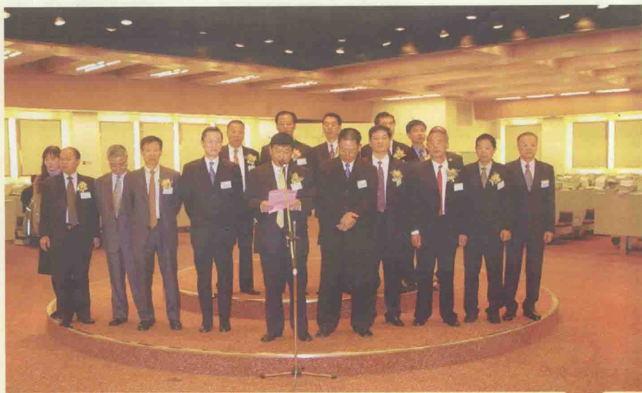
在香港联合交易所交易大厅举行上市仪式