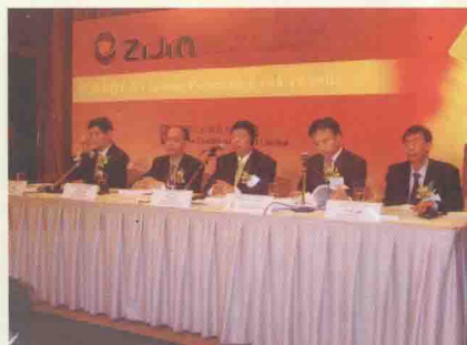
在香港举行企业推介会