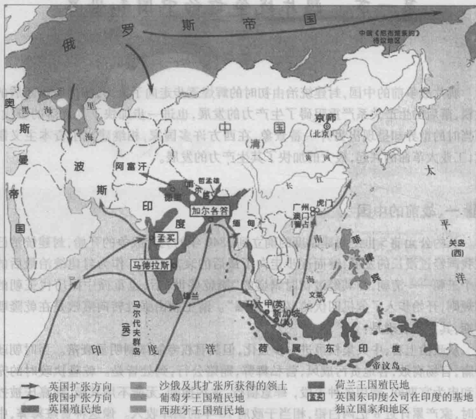
鸦片战争前夕的中国周边形势

额的租金,也致使这种局面越来越严重。地租剥削,赋税征收,徭役摊派逐年加重,使农民生活更加贫困不堪,这必然会加剧阶级冲突和社会矛盾。