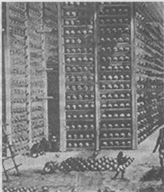
东印度公司的鸦片仓库

雍正七年(1729)清廷下令禁烟,但只惩办贩运,并未禁止吸食,而且进口未止,鸦片依然按药材进口收税。到嘉庆年间清政府曾一