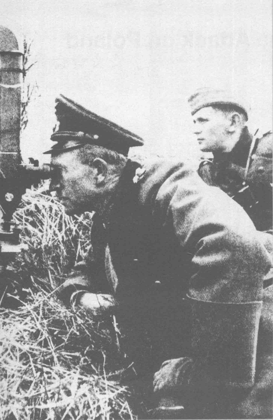
★ 德军入侵波兰之前，德装甲部队指挥官古德里安正在波兰边境地区观察地形。