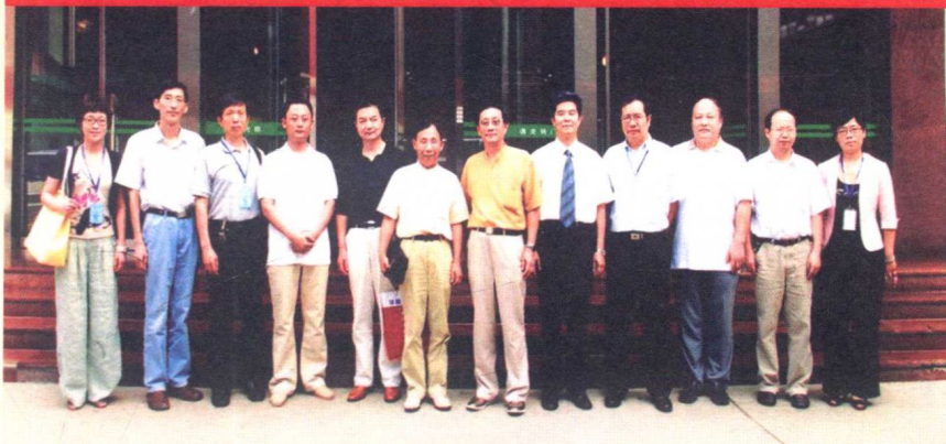
作者与山东中医药学会脉学研究专业委员会成立大会部分代表合影