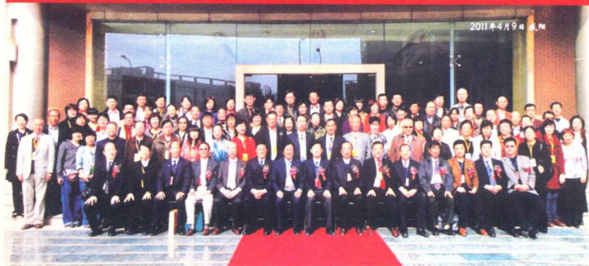
作者参加第二届中医脉象国际学术大会