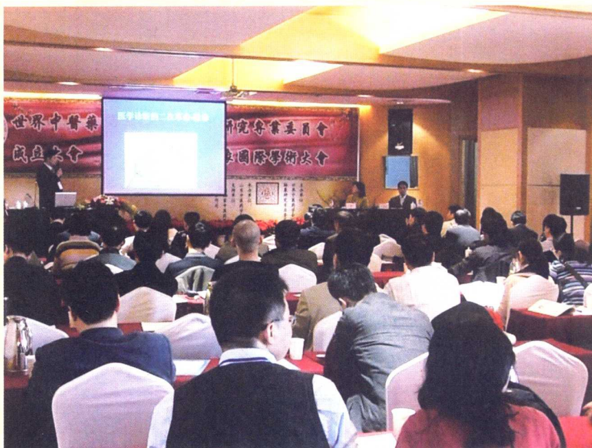
作者在象脉国际学术会上讲演