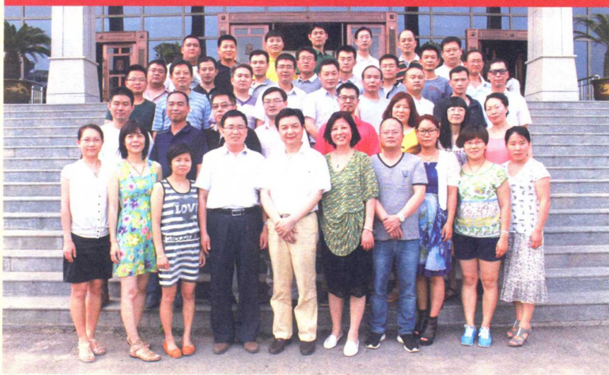
作者与夫人和师承班第九期学员合影