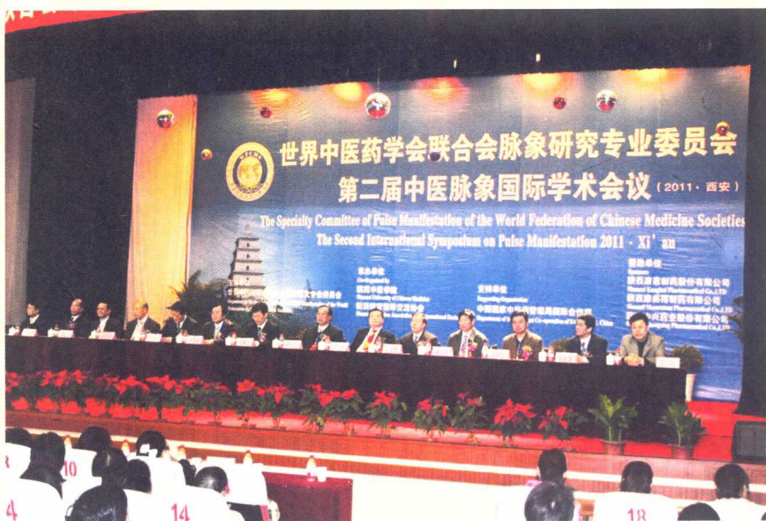
作者在第二届中医脉象国际学术大会主席台上就座