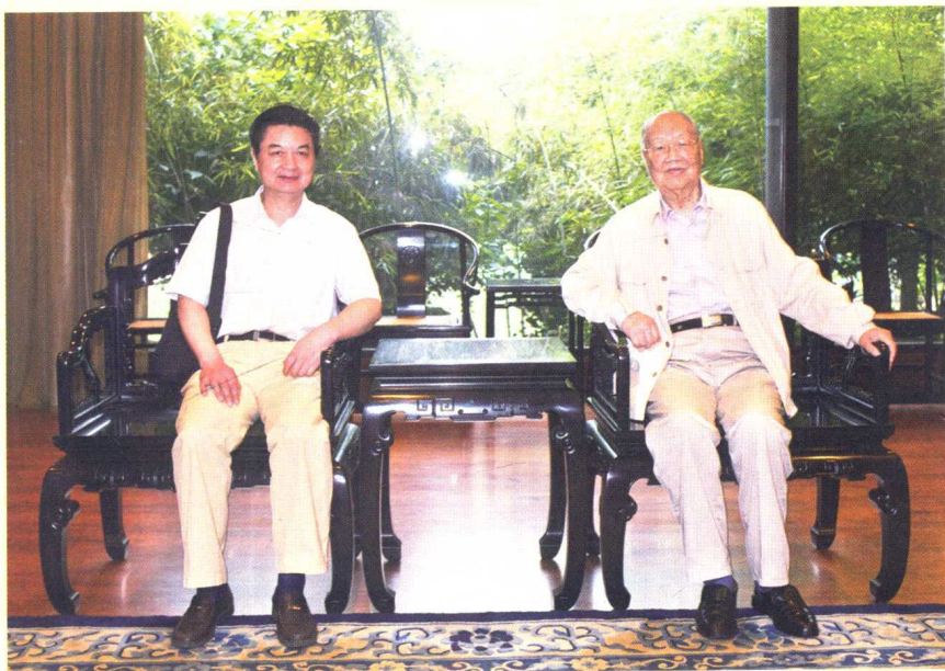
作者与国医大师朱良春合影