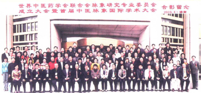
作者参加首届中医脉象国际学术大会