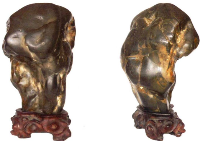
世界杯奖杯/回头鹰——来宾石（12cm×19cm×12cm）

古人玩石喜好“上大下小”，所谓“云头雨脚”。上图中的来宾石非常符合古人的审美情趣，更奇的是从各个角度欣赏此石，分别呈现出“世界杯奖杯”、“巴尔扎克”以及“回头鹰”的不同风姿。经专家认可，该奇石收录在著名的《上海赏石》杂志中，取名“巴尔扎克”。