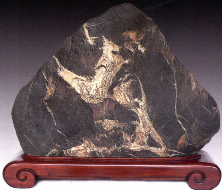
仙鹤图——白灵璧原石

艺术修养提升了，审美能力提高了，方能发现并赏读真正精美无比的奇石。如下图白灵璧原石，外形犹如一个寿桃，明快清朗的白色部分神似一只写意的仙鹤，其眼睛、嘴巴清晰可见，翘起的尾巴和大写意的两只脚平添了几分灵动。最难得的是寿桃寓意长寿，仙鹤同样寓意长寿，作品体现的就是“寿上加寿”。该奇石在迎世博国际石展中获得精品石的荣誉。