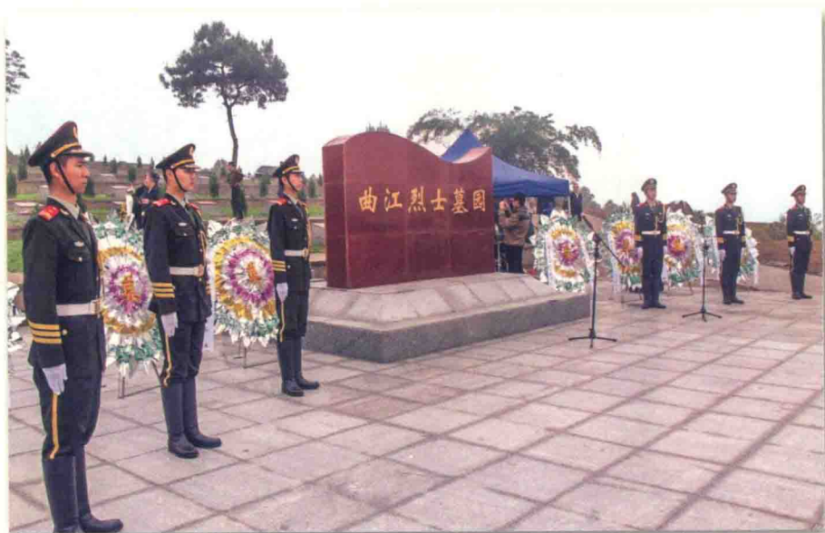
曲江烈士墓园于2013年4月2日举行隆重的落成仪式