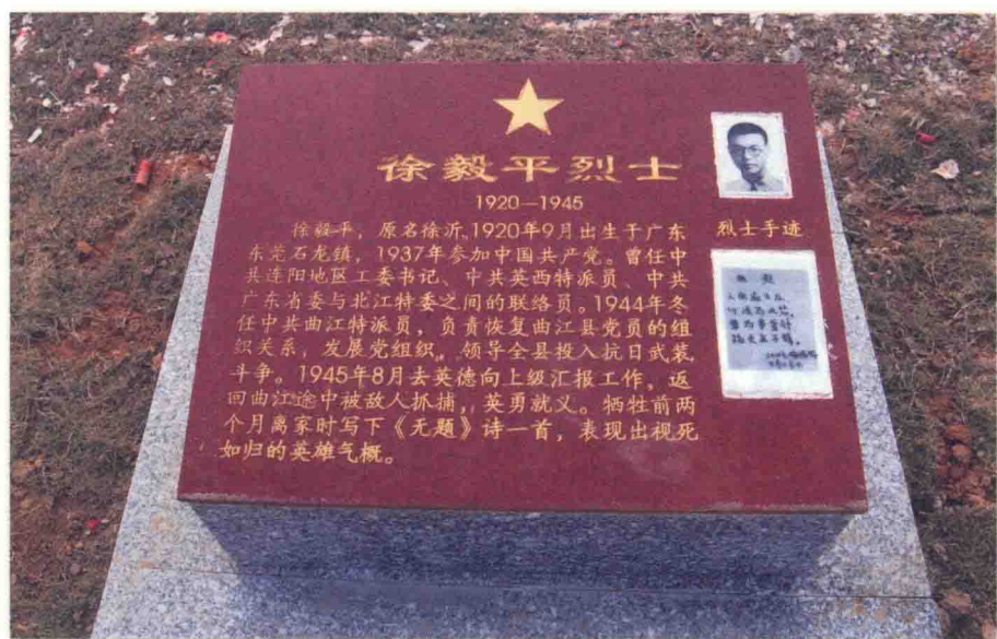
韶关市曲江区烈士陵园内的徐毅平烈士墓