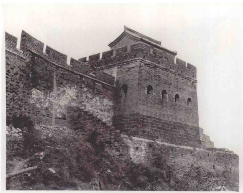
金山岭长城空心敌台