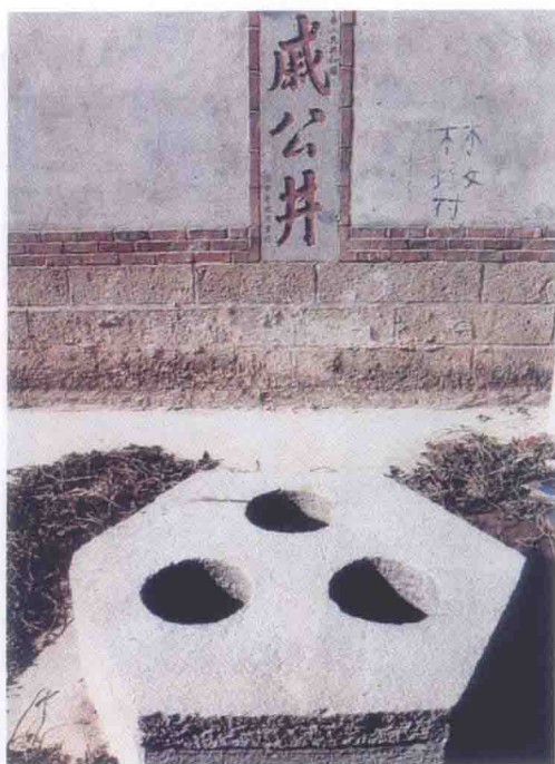
莆田黄石林墩戚公井