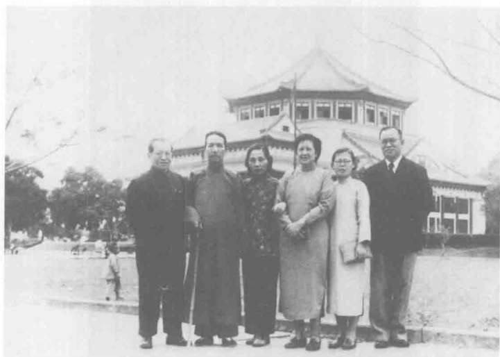
陳寅恪、唐質與陳序經、姜立夫夫 婦於廣州中山紀念堂前留影