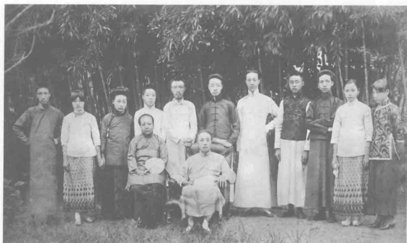
寅恪父散原先生丙辰年九月廿一日 壽辰與家人合影於南京頭條巷俞宅 之竹園