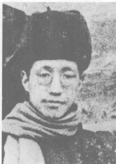
抗日戰爭前攝於北平北海