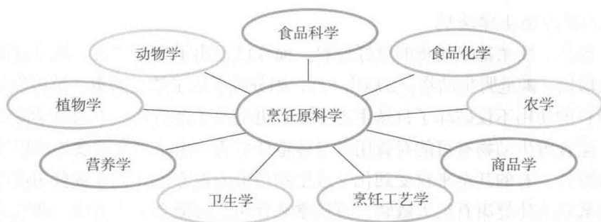
图1-1 烹饪原料学与相关学科的联系

从烹饪原料的使用目的来看, 与人体营养学、医学有着非常密切的关系。人体需要的营养素来自原料, 对烹饪原料的营养分析和评价, 是烹饪原料最重要的内容之一。我国自古就懂得“医食同源”的道理。近年来, 随着对医学、免疫学知识的深入研究, 从烹饪原料中发现功能性成分, 开发药膳烹饪、营养配餐, 已经成为重要课题。因此, 烹饪原料学与营养学、医学的关系也越来越密切。