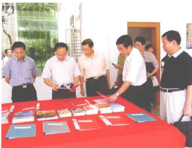
市区领导参观人和镇东华村“廉政文化进农村”展览