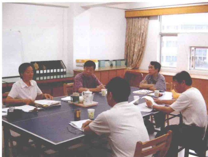
大赛编委在研究“廉政文化杯”作品编辑工作