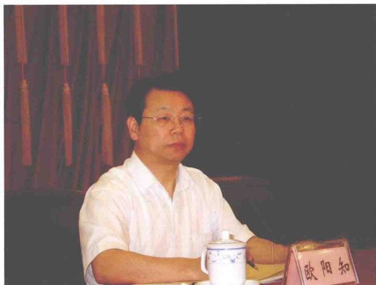
白云区区长欧阳知同志在区纪委第六次全体（扩大）会议上讲话