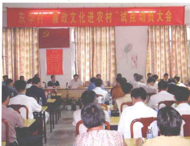
人和镇东华村“廉政文化进农村”动员大会