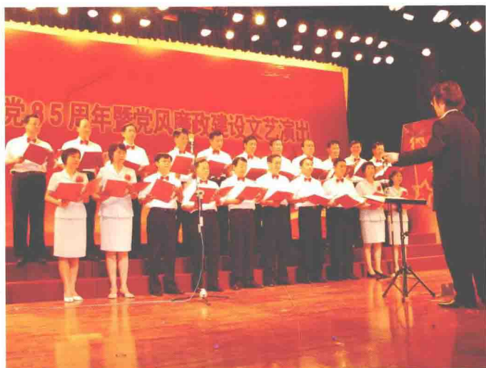
白云区五套班子领导带头参加廉政文化文艺 汇演