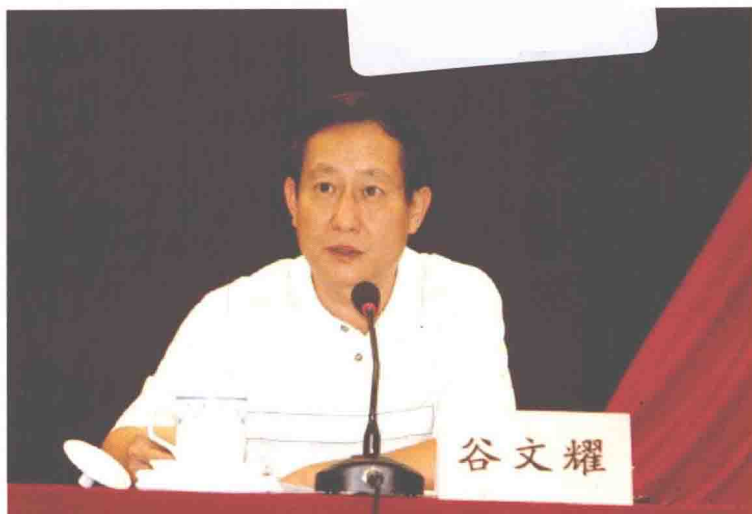
白云区委书记谷文耀同志在区纪委第六次全体（扩大）会议上讲话