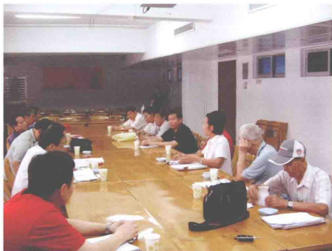
大赛评委在评选获奖作品