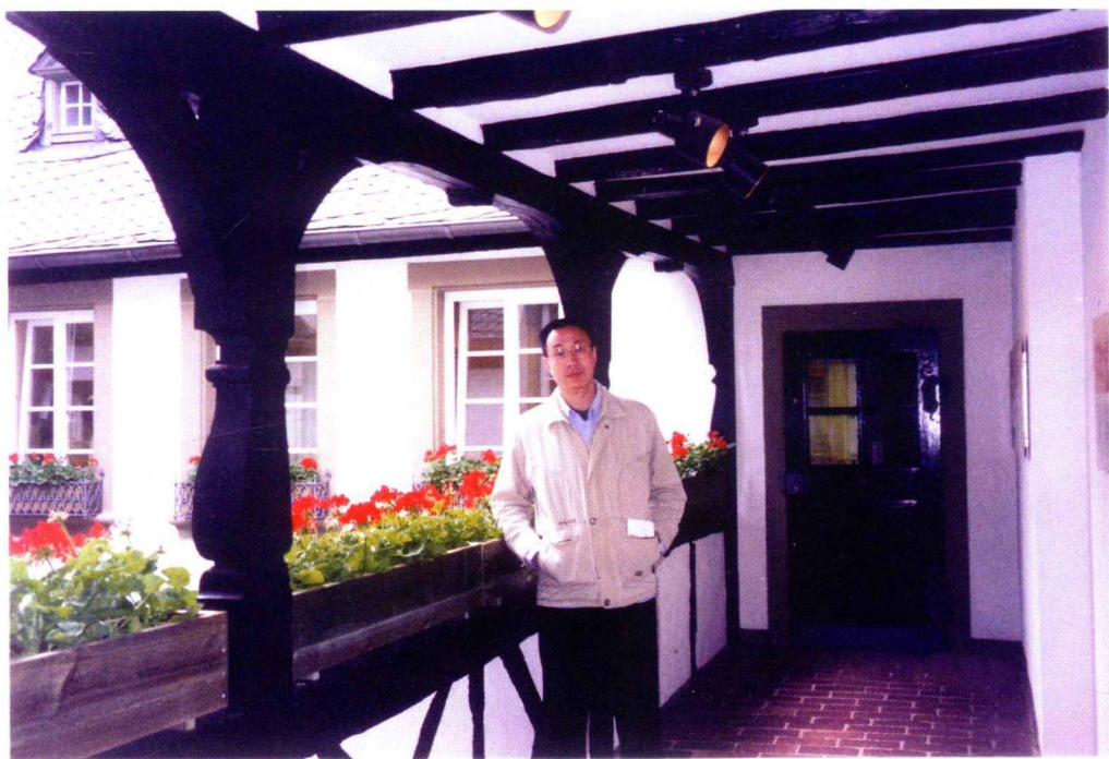
白暴力先生2001年于德国马克思故居