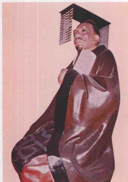
第十八世 去齊 句卑長子，生周惠王二十年，在位三十五年。