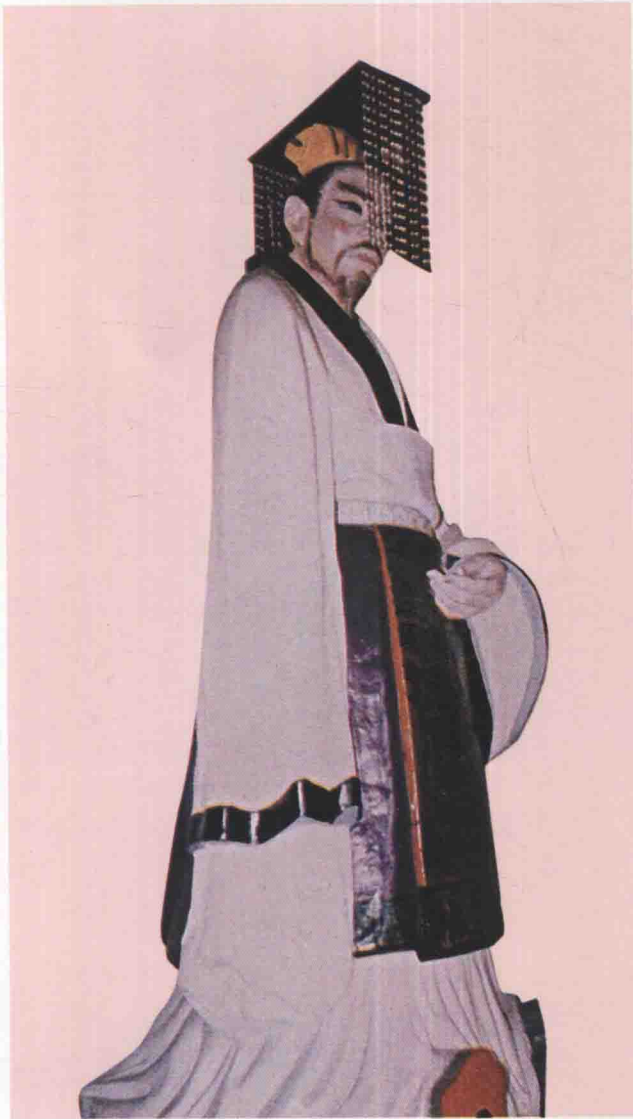
第十九世 壽夢 去齊子，生周襄王二十年，前585年接位吳始益大，稱王，諸侯尊為盟主，前561年卒，在位二十五年。