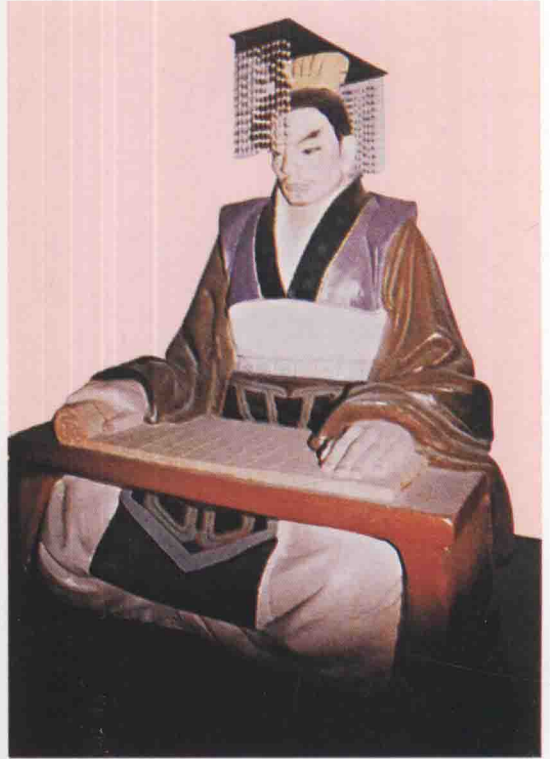
第九世 餘橋疑吾 鳩夷子，生周昭王己未，在位三十八年。