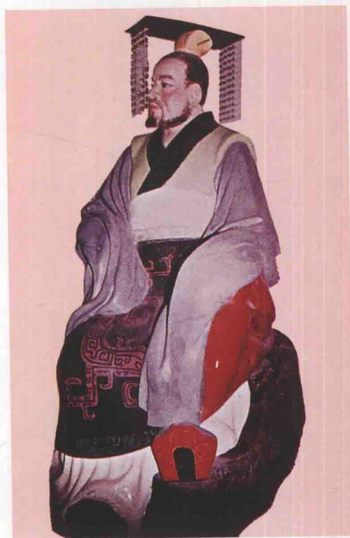
第十二世 屈羽 繇之子，生周懿王庚戌，在位三十四年。