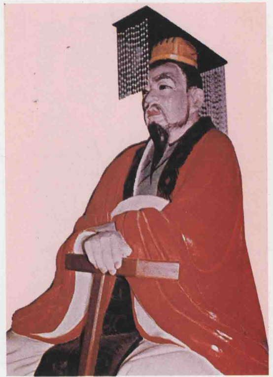
第二十二世 余昧 夢三子，余祭弟。前527年卒，在位十七年。