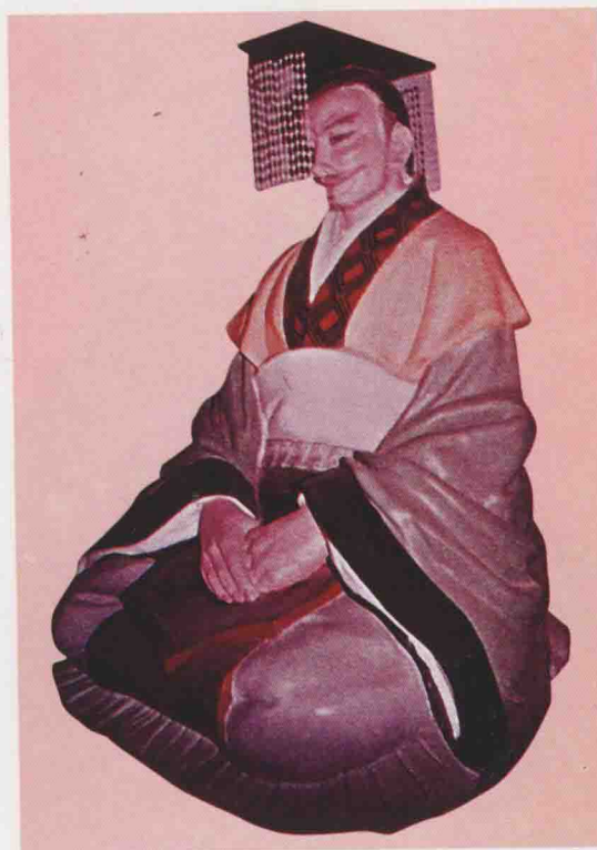
第十四世 禽處 吾之子，生周相召共和甲子，在位三十九年。