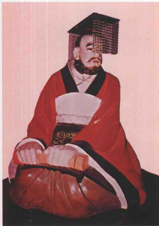
第十七世 句卑 高長子，又名畢軫，生周壯王四年，在位五十一年。