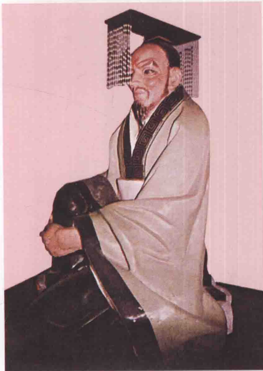
第四世 叔達 季簡長子，生殷庚丁十三年，在位十八年。