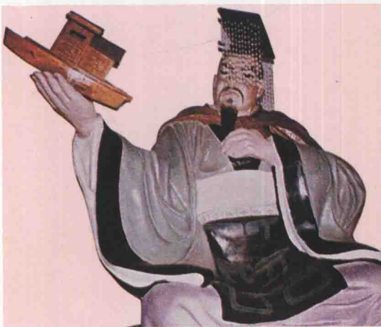
第二十一世 余祭 夢次子，諸樊弟。襲兄位，欲兄弟相傳，使札得以為主。在位四年。