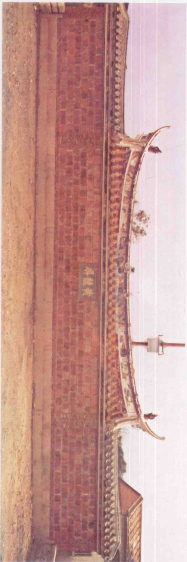
黃龍吳氏家廟照牆像