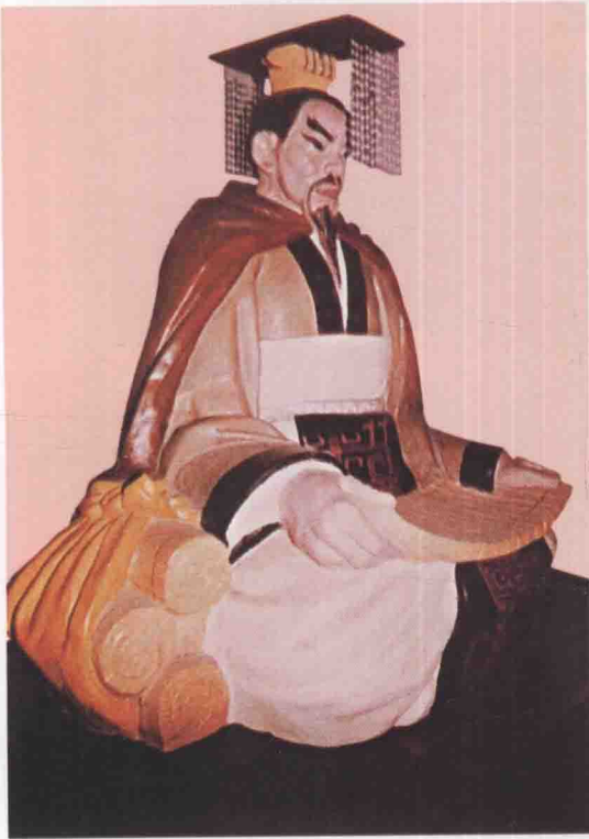
第三世 季簡 泰伯嗣子，生殷祖甲十五年，在位三十一年。