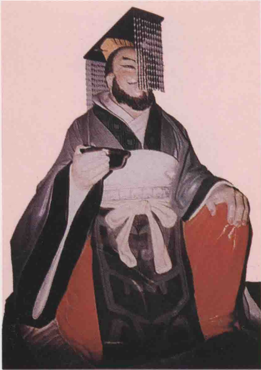
第七世 柯相 遂之子，生周成王己巳。在位三十年。