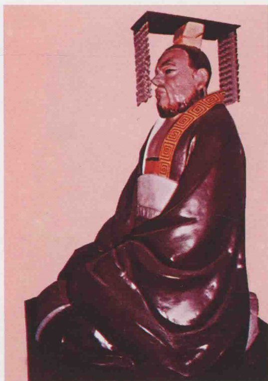
第十六世 頗高 轉之子，生周平王二十二年，在位九年。