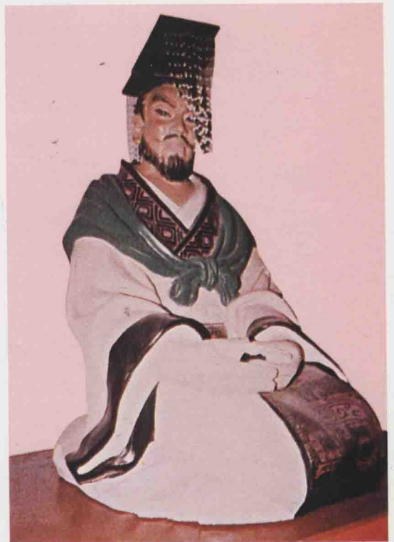
第六世 熊遂 周章長子，生商紂二十年，在位四十八年。