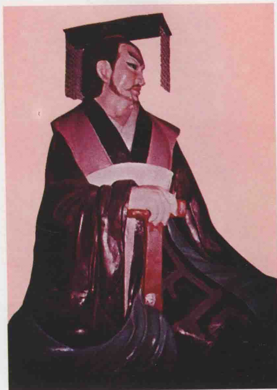
第十三世 夷吾 羽之子，生周厲王丁亥，在位三十三年。