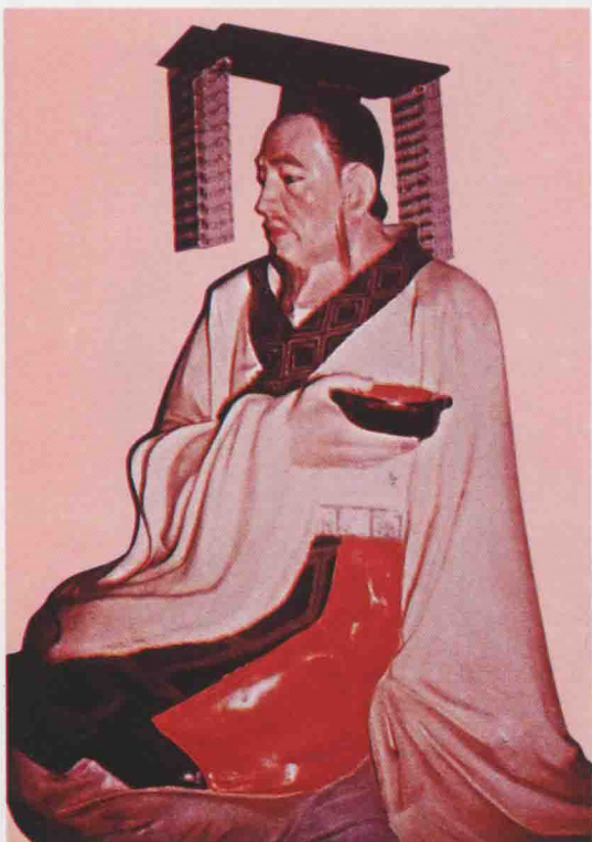
第十五世 轉 處之子，又名君轉，生周宣王庚子，在位四十一年。