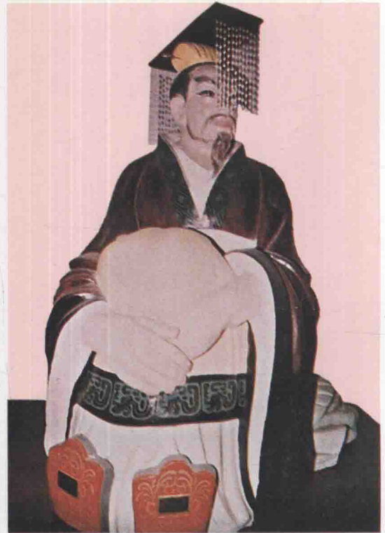
第十世 柯盧 疑吾次子，生周穆王丙申，在位五十九年。