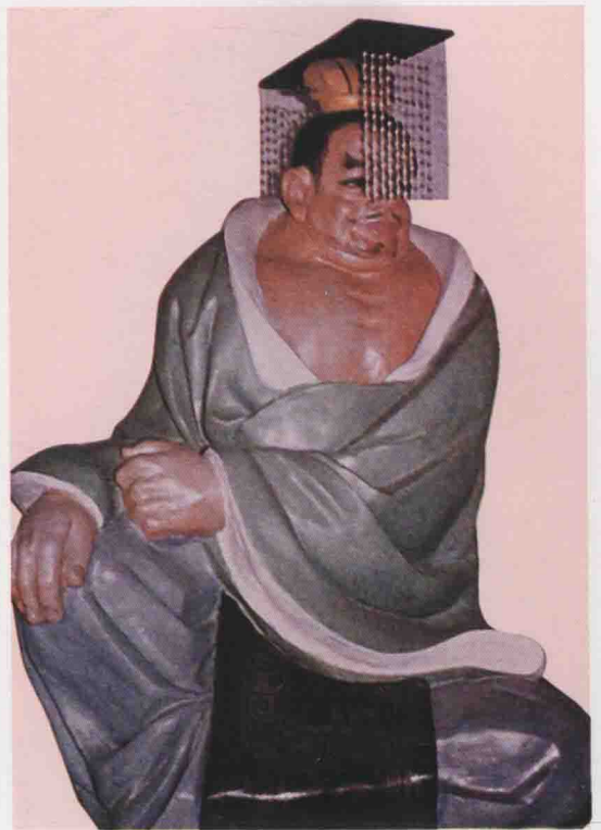
第二十世 諸樊 壽夢長子，遵遺命讓位于季札，札不受，乃嗣位稱王，在位四年。