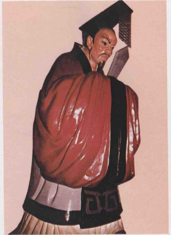
第五世 周章 叔達長子，生殷帝乙二十二年。武王克殷，因周章已君吳，封吳伯列為諸侯，在位二十二年。