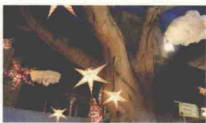
5/7 MS-Bamboo 里的 miss