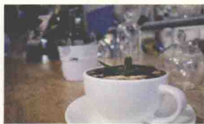
3/7 寻常巷陌处的气质