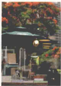
2/7 雕刻时光里的秘密