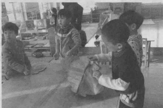
子源自己能独立打开一个灯笼

小远找到子源说：“子源，能帮我把灯笼粘起来吗，我试了老半天也没有成功！”看着子源将手指伸进小洞捏一捏，灯笼就粘好了，小远既佩服又感激！