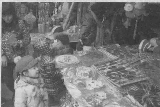
哇！年集上的物品可真多呀