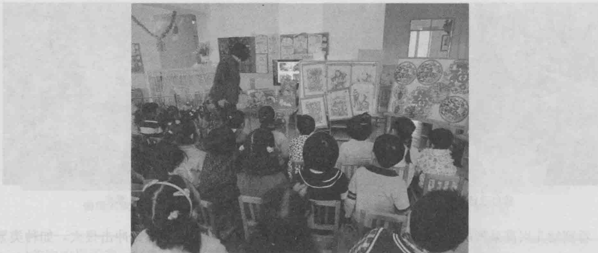
幼儿欣赏、观察众多的年饰品