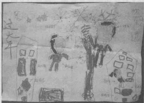
情境式家庭赶年集计划