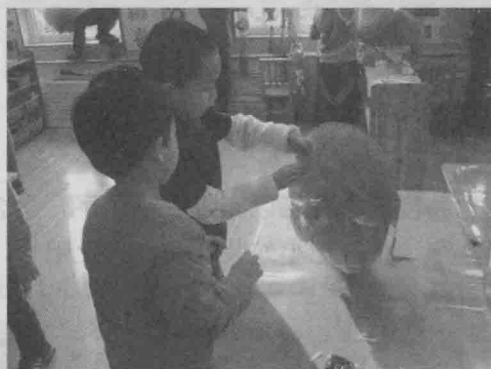
子源帮小远把灯笼粘贴在一起