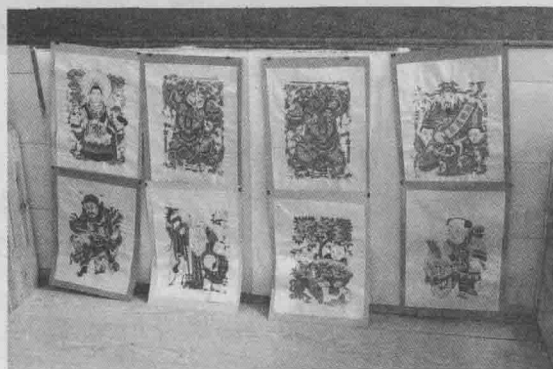
年画整齐地挂起来