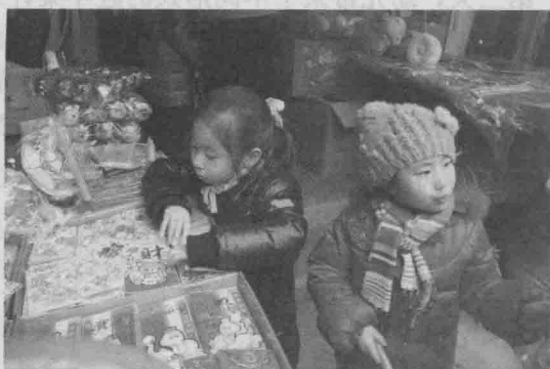
认真观察蛇年日历