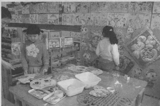
调整福字：大福字贴在中间，这样更好看