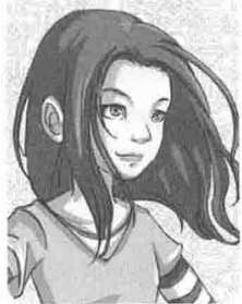
艾米·卡希尔 ( Amy Cahill )

十四岁，有一头棕红色长发和翠绿色的眼珠。葛蕾丝的外孙女。内向腼腆，不善于人交流，隐藏自己情绪的方法是沉浸在书堆里，最爱待在图书馆，酷爱阅读。