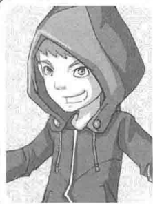
丹·卡希尔 ( Dan Cahill )

十四岁，有一头棕红色长发和翠绿色的眼珠。葛蕾丝的外孙女。内向腼腆，不善于人交流，隐藏自己情绪的方法是沉浸在书堆里，最爱待在图书馆，酷爱阅读。