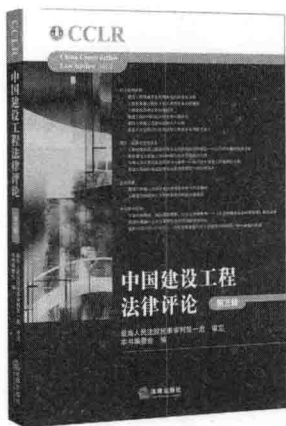
中国建设工程法律评论(第三辑) 本书编委会 编 书号: 978-7-5118-7286-9 定价: 68 元

本书由最高院民一庭评审出的获奖作品及征文中的其他优秀作品汇集而成，内容具有较强的实务性，涉及仲裁或司法审判实务中建设工程问题、建设工程及项目管理风险防范及多层次争议解决途径、相关立法新动向、中国企业承揽境外建设工程经验及教训总结、FIDIC等合同在中国使用状况等，切合建设工程实务热点，具有较强的指导意义。