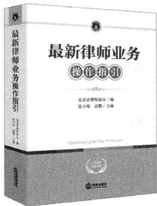
最新律师业务操作指引 北京市律师协会 编 书号：978-7-5118-7801-4 定价：98 元

本书由北京市律师协会组织各律师业务委员会编写，分为民事篇、商事篇、知识产权篇、刑事篇以及诉讼仲裁篇，收录了婚姻家庭业务、合同起草与审查业务、建设工程业务、劳动人事业务、公司并购业务、私募股权投资业务、刑事业务以及仲裁业务等 22 个律师业务操作指引。