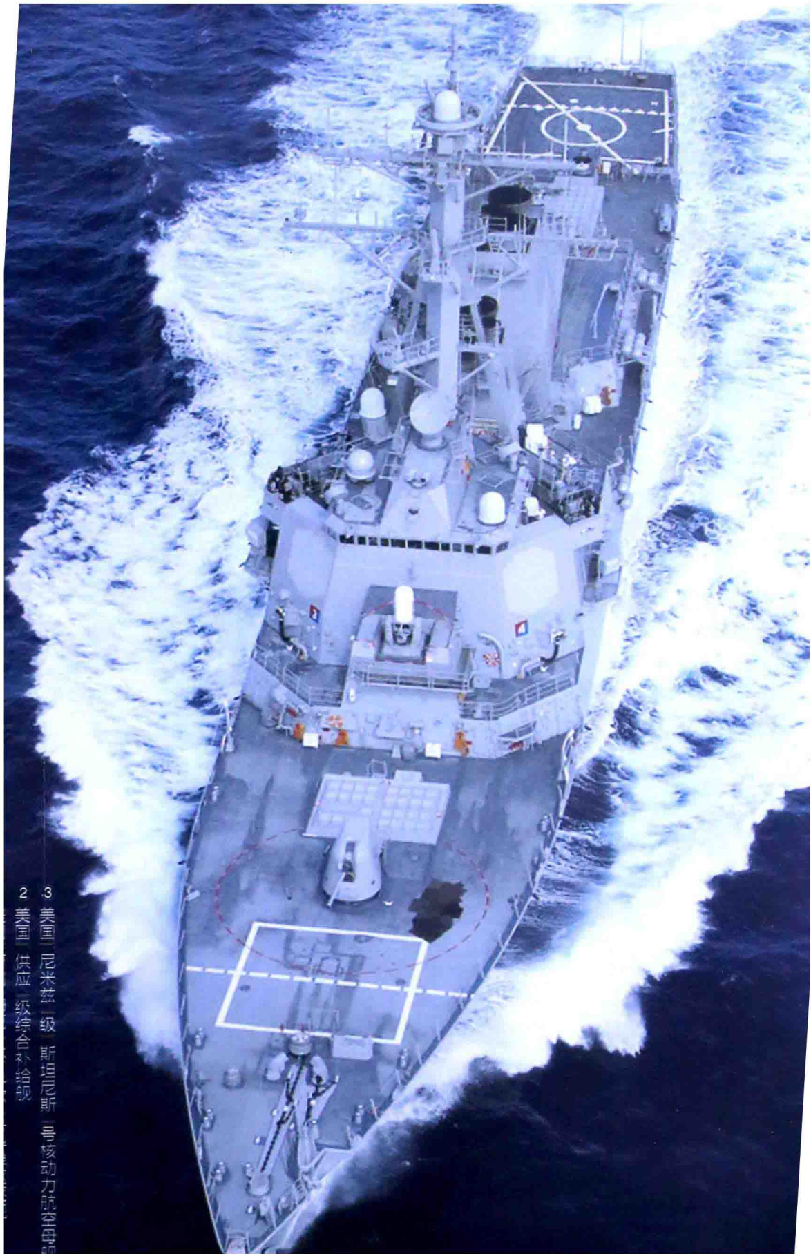
2 美国 供应一级综合补给舰 3 美国 尼米兹级 斯坦尼斯 号核动力航空母舰