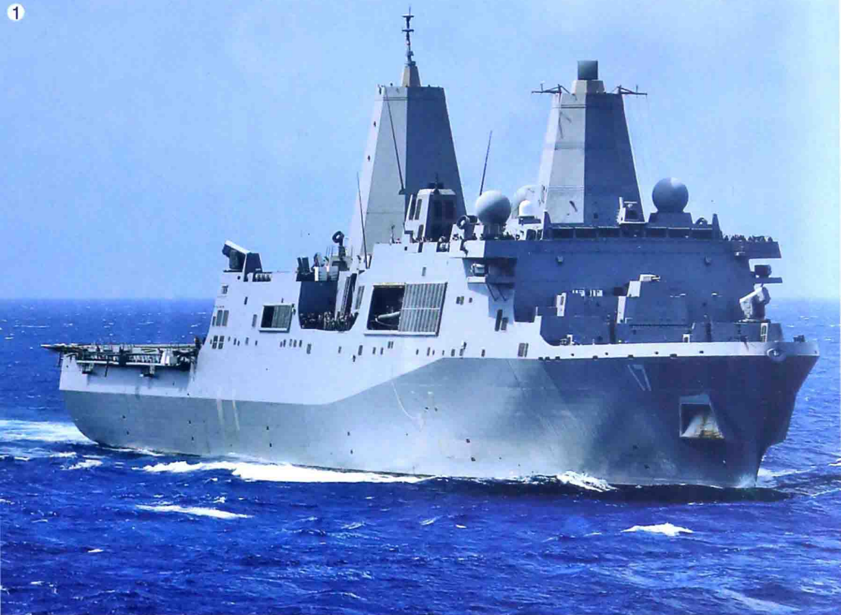
1 美国“圣安东尼奥”级两栖船坞运输舰