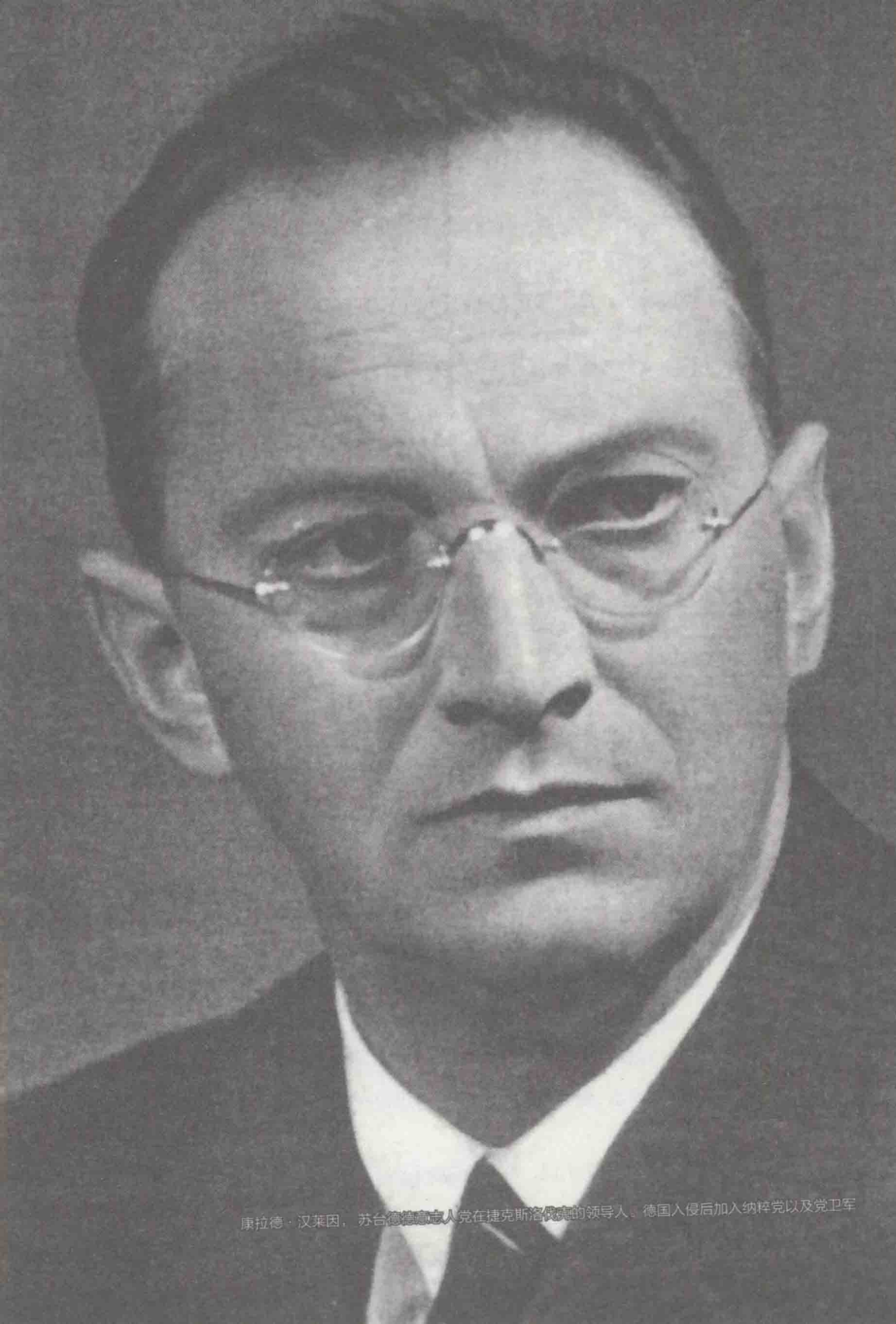
康拉德·汉莱因，苏台德德国人党在捷克斯洛伐克的领导人。德国入侵后加入纳粹党以及党卫军