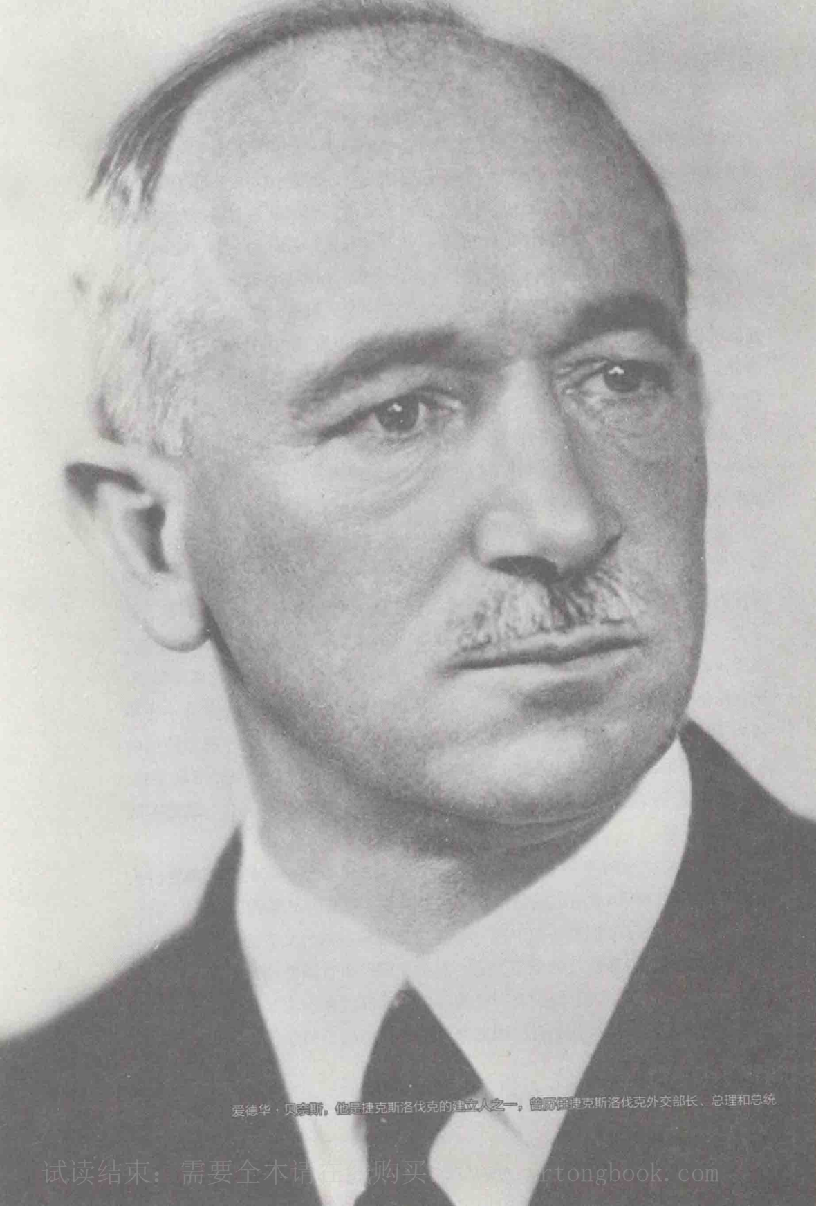
爱德华·贝奈斯，他是捷克斯洛伐克的建立人之一，曾历任捷克斯洛伐克外交部长、总理和总统