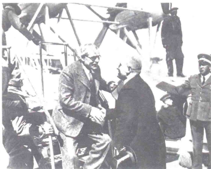
R 麥克唐納 英國首相，英國工黨的創立者之一，也是第一位工黨首相。圖為1933年3月麥克唐納訪問羅馬時，墨索里尼親赴機場歡迎。

麥克唐納曾出版數本書，包括《南非見聞》(What I Saw in South Africa, 1905)、《社會主義及政府》(Socialism and Government, 1909)、《印度政府》(The Government of India, 1919)、《國會與民主》(Parliament and Democracy, 1919)、《社會主義：批評與建設》(Socialism: Critical