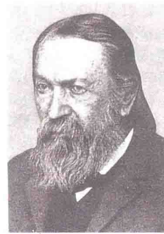
E.馬赫 奧地利物理學家、心理學家兼科學哲學家。

經濟的方法摘錄下來,因爲這些記載可以讓我們在遇到不同情況時,很快的就想起以前所遇到的一些經驗。任何物理的學說,與物體有關,若不能化簡爲一般可知覺的經驗,則不能稱爲學說,只能說是玄學。例如,研究科學應該摒棄絕對空間和絕對時間的觀念。因爲空間並非單獨存在的東西,其性質要視內部的物質,分布情況而定。另一種說明其觀念的方法是馬赫原理,他體認到一個物體的運動,只有在相對於宇宙中其他物體時來描述才是有意義的,而不是以絕對空間的觀念來描述。另外,一個過程運作的時間,只能與時鐘上時針、分針運轉了多少來比較;而絕非以絕對時間前進多少來比較。馬赫在這一方面的教旨,對於愛因斯坦及起源於維也納馬赫創設之知識領域的歐洲邏輯實證主義,有相當大的影響。