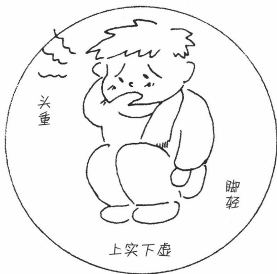
图引-2 上虚下实与上实下虚