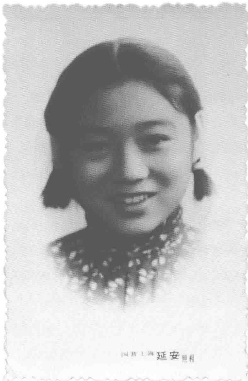
慢慢自信的中学生