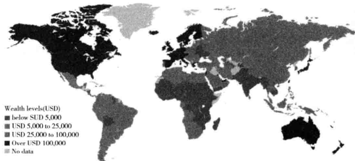
Figure 4 World wealth levels 2013 Source: James Davies, Rodrigo Llorens and Anthony Shorrocks, Credit Suisse Global Wealth Databook 2013

数据来源:2013 Global Wealth Report, Credit Suisse。