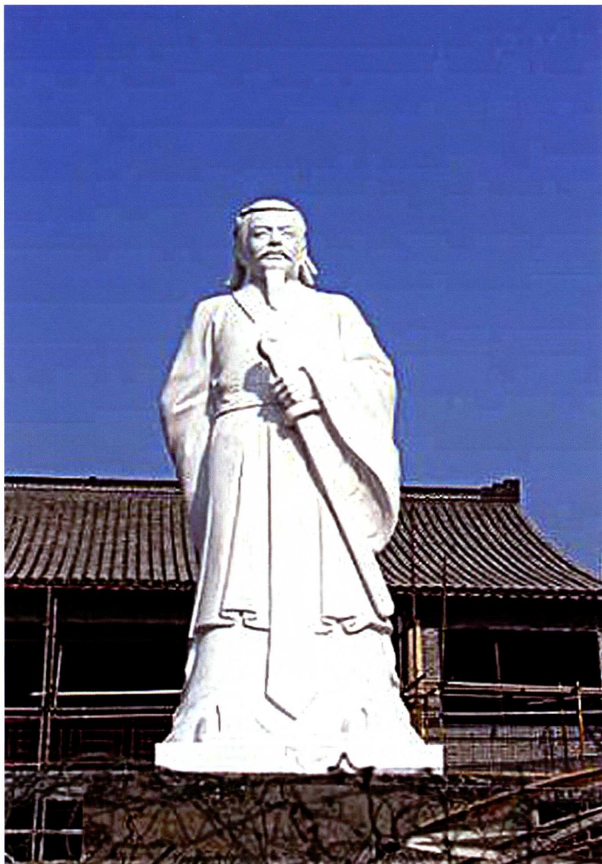
2014年1月2日先贤仲子的汉白玉塑像 在江苏海安蓉和怡心园落成