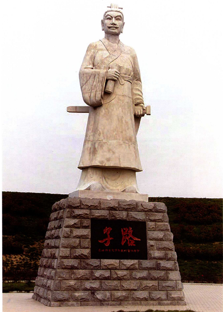
子路——蒲城第一县令