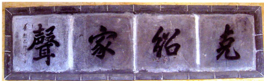
康熙皇长子直郡王胤禵在山东仲家浅仲子庙为仲子后裔题词