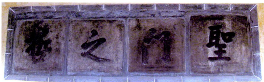
康熙皇帝在山东济宁仲家浅仲子庙为仲子题词