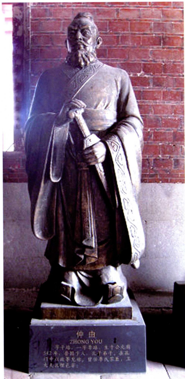
仲子——中国武学开创者的突出代表