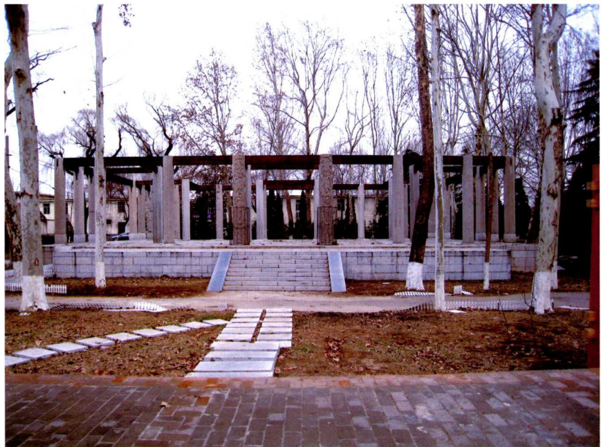
山东泗水仲子庙遗址