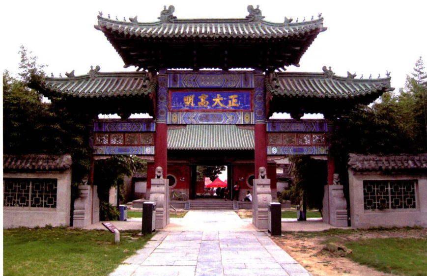
河南濮阳仲夫子墓、祠“正大高明”牌坊