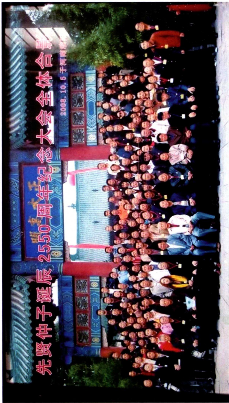
2008年10月5日，河南濮阳召开先贤仲子诞辰2550周年紀念大會