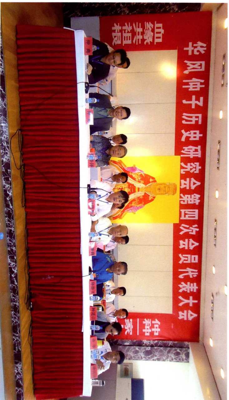
2013年5月17—18日在山东枣庄召开华风仲子历史研究会第四次会员代表大会 (上图是会场主席台就座人员)