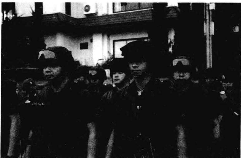
中国警力赴泰破案

泰国《曼谷邮报》报道，泰国军方称，一伙由缅甸毒枭糯康的贩毒集团被认为是在湄公河枪杀中国船员的幕后黑手。这伙毒贩劫持往来于湄公河上的船只，并索取保护