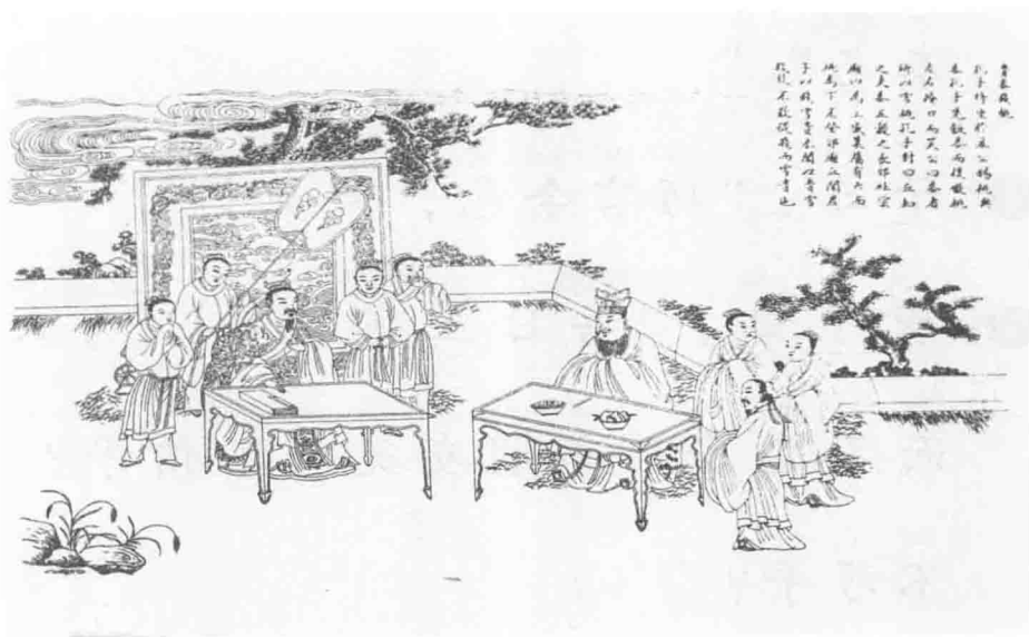
孔子圣迹图·贵黍贱桃