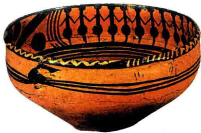
舞蹈人纹盆 新石器时代

唐朝是我国历史上空前强盛的时期，陶瓷工艺取得了新的成就。其中最突出的是唐三彩。唐三彩是一种低温铅釉陶器，以白色黏土为胎，用含有铁、铜、钴、锰等元素的矿物作釉料着色剂，色彩丰富，它的釉彩有黄、绿、白、褐等，以黄、白、绿三种颜色为主，称为唐三彩，其中蓝、黑釉最为珍贵。釉料在烧制过程中，各种颜色相互交融，形成绚丽多彩，如天空彩云变化无穷，千姿百态的斑驳灿烂的艺术效果。唐三彩主要是用于殉葬的明器，日用器皿很少，出土地点集中在首都长安和东都洛阳。它的品种极为丰富，除了日用器物的碗、盘、壶、杯、枕、烛台等，明器有人物俑和动物俑，骆驼