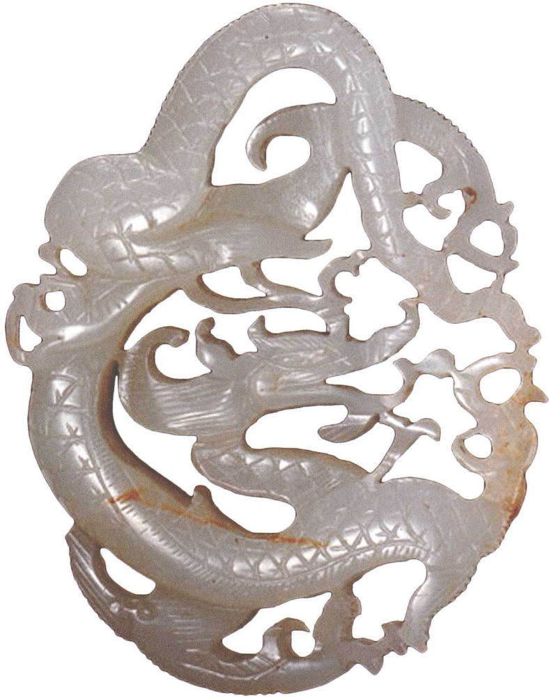
宋·云龙佩 现藏中国国家博物馆