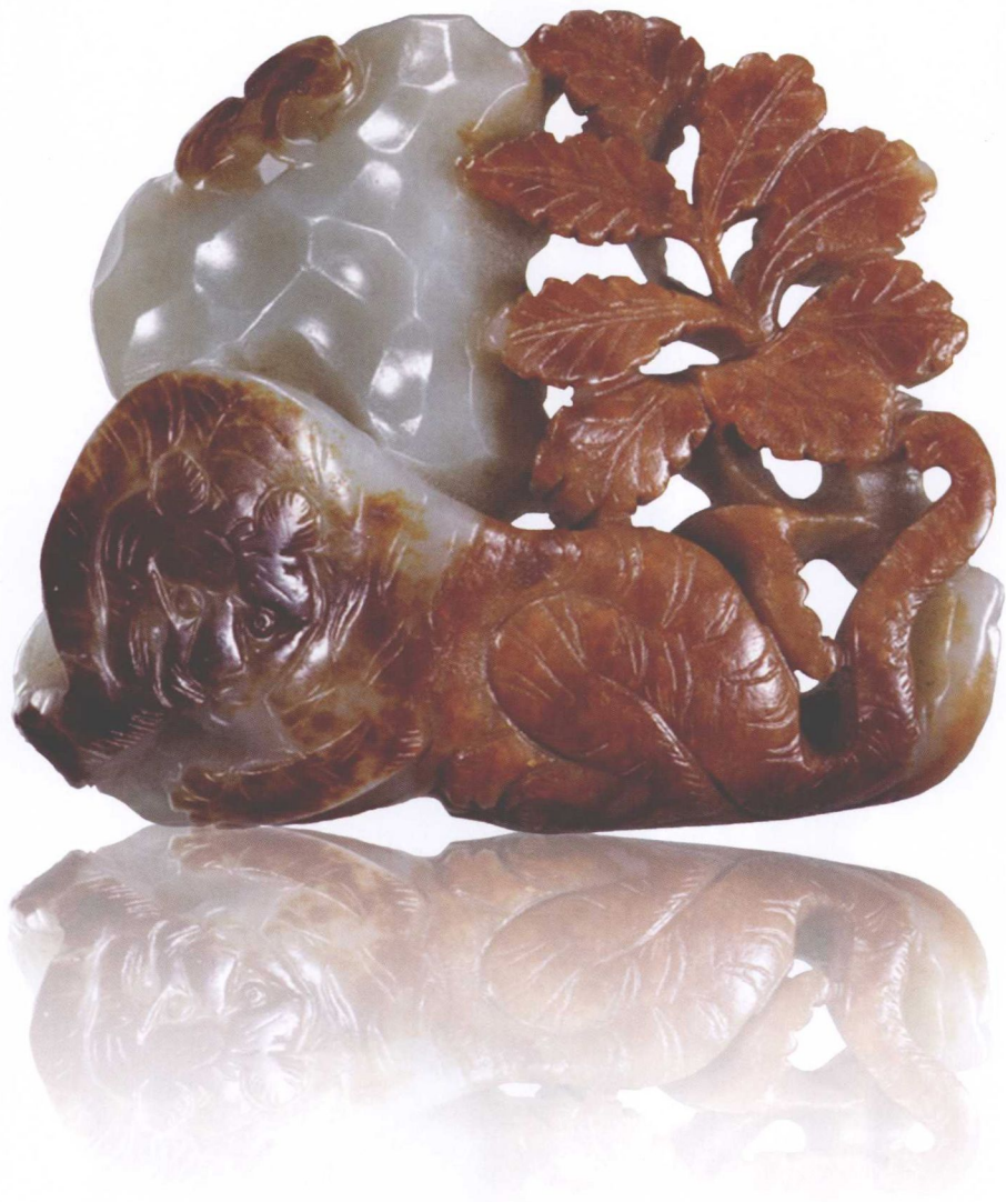
元·山石卧虎摆件 现藏中国国家博物馆