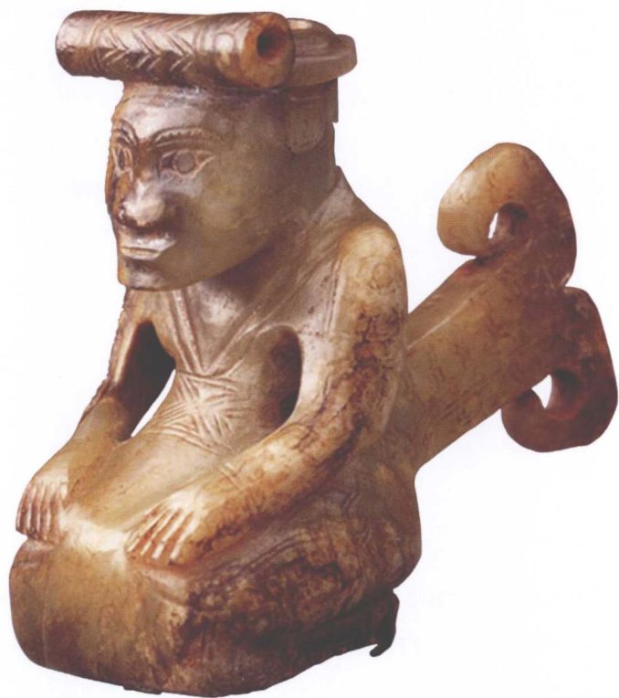
商·跪坐玉人 现藏中国国家博物馆

这种玉主要分布在新疆的莎车——塔什库尔干、和田——于田、民丰——且末一带绵延 1000 多千米内的昆仑山北坡，共有九个产地，是有名的软玉石品种。《史记·大宛列传》：“汉使穷河源，河源出于阆，其山多玉石。”《汉书·西域传》中：“莎车国有铁山，出青玉。”这都是对新疆和田玉的早期史料记载。从殷商时期开始，和田玉就进入了中原。和田玉从新疆经过甘肃、陕西，甚至走山西才能运抵今天的河南，路途漫长，尤显珍贵。汉朝张骞出使西域后，和田玉大量进入中原，成为玉器制作的首选材料，并成为中国玉文化的象征。汉代文学家东方