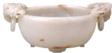
清·螭衔灵芝双耳洗 现藏中国国家博物馆