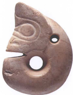
玉猪龙 新石器时代后期·红山文化 现藏中国国家博物馆

在旧石器时代，人们还缺乏甄别玉与石的能力，所以生产工具中就夹杂着许多以玉石为材料制成的，基本处于玉、石混用阶段。到了新石器时代，人类经过长期的实践总结，能够以