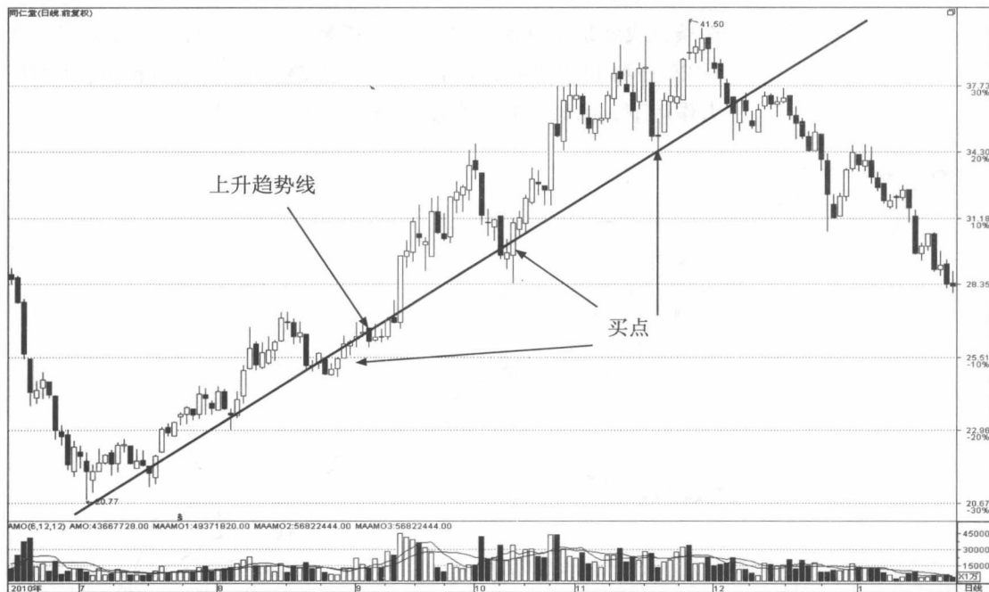
图 1-1 同仁堂（600085）上升趋势线

上升趋势线又称为支撑线，不仅能指出股价运行的趋势，而且对股价具有支撑作用。股价每次回试上升趋势线不破都是很好的买点。根据几何学里画线原理，两点确定一条直线，所选的两点之间的时间越长，上升趋势线的支撑作用就越牢固；股价回试上升趋势线的次数越多，也就是说上升趋势线上的回试点数越多，趋势线的支撑作用就越牢固（图 1-1 所示）。