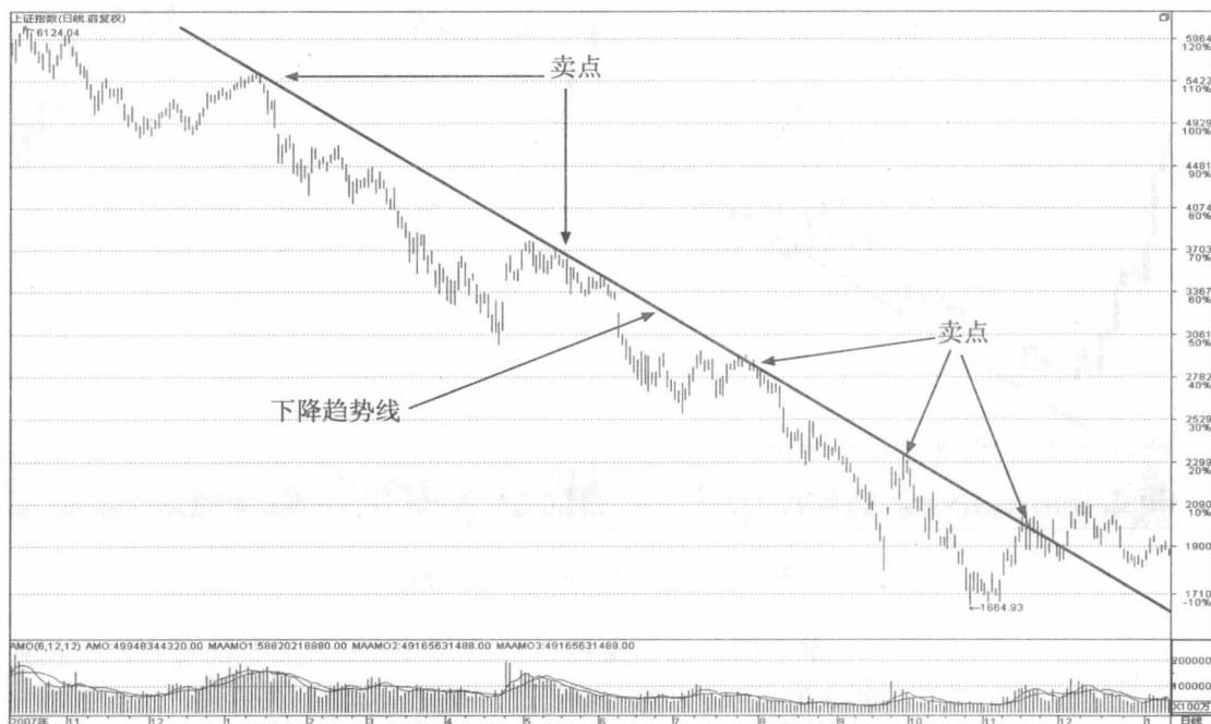
图 1-2 上证指数 (999999) 下降趋势线

如图 1-2 所示，2008 年 1 月 5 日和 2008 年 5 月 15 日出现了两个明显的转折点，以这两个明显的转折点为基点画出一条直线，这条直线就是下降趋势线。上证指数在 6 月 2 日、7 月 28 日、9 月 25 日和 11 月 19 日又分别回试了此趋势线，在下降趋势线的压力作用下，指数遇到压力反弹结束，又开始下跌。