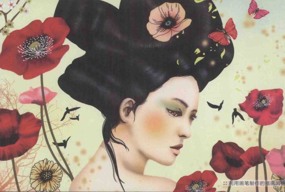
利用画笔制作的插画风格