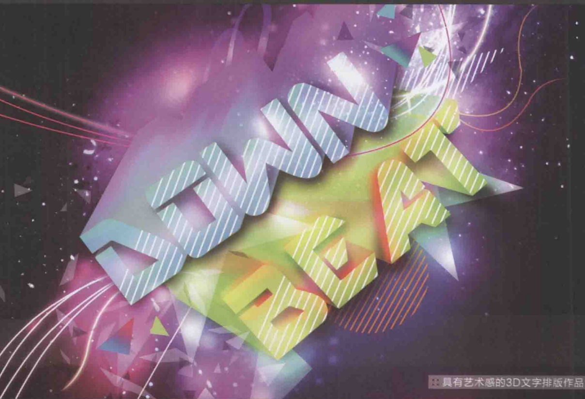
具有艺术感的3D文字排版作品