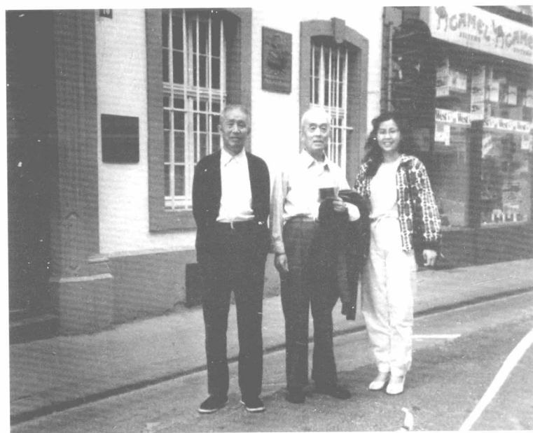
1981年重返德国，在哥廷根大学