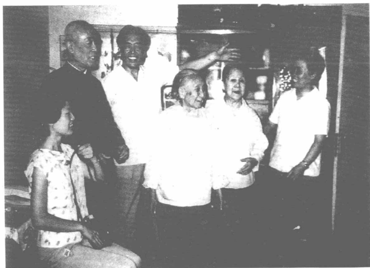
与婶母（右三）、夫人（右二）、儿、女和孙女合影