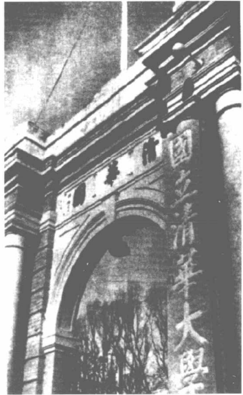
20世纪30年代初期的清华大学南校门