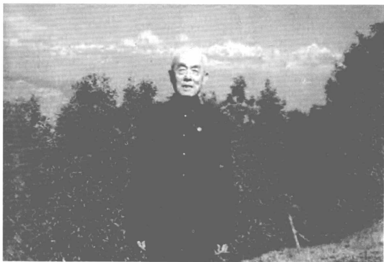
1986年11月29日，作者访问尼泊尔时留影，背后远处为珠穆朗玛峰