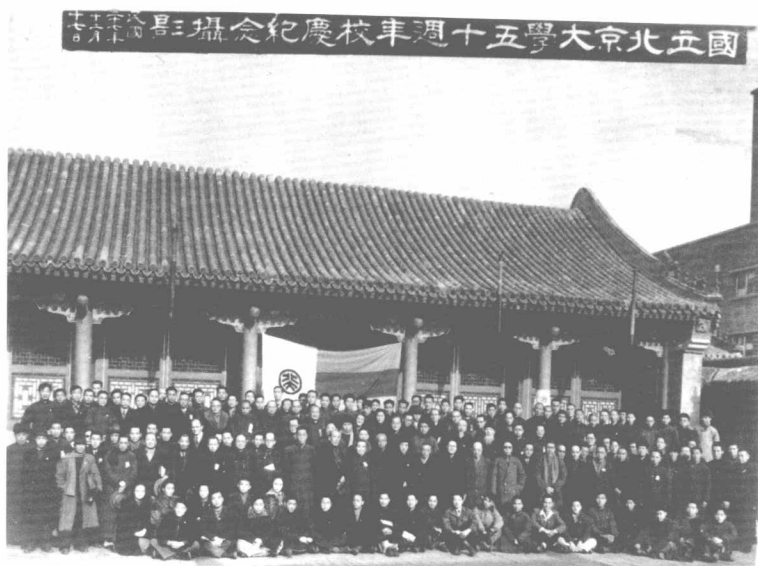
北京大學 50 周年校慶留念