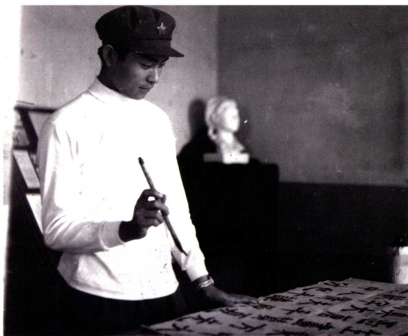
1979年，在入伍期间从事艺术创作