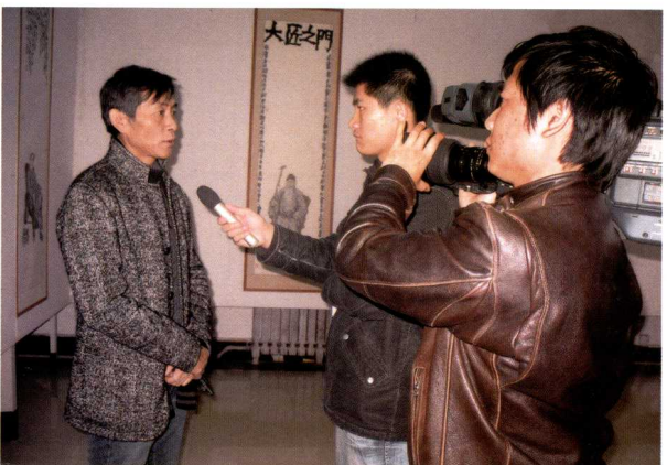
2008年在辽宁美术馆举办展览期间，接受当地媒体采访