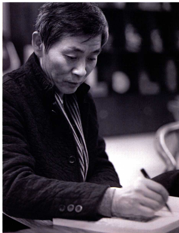
在举办个人画展期间，为观众签名