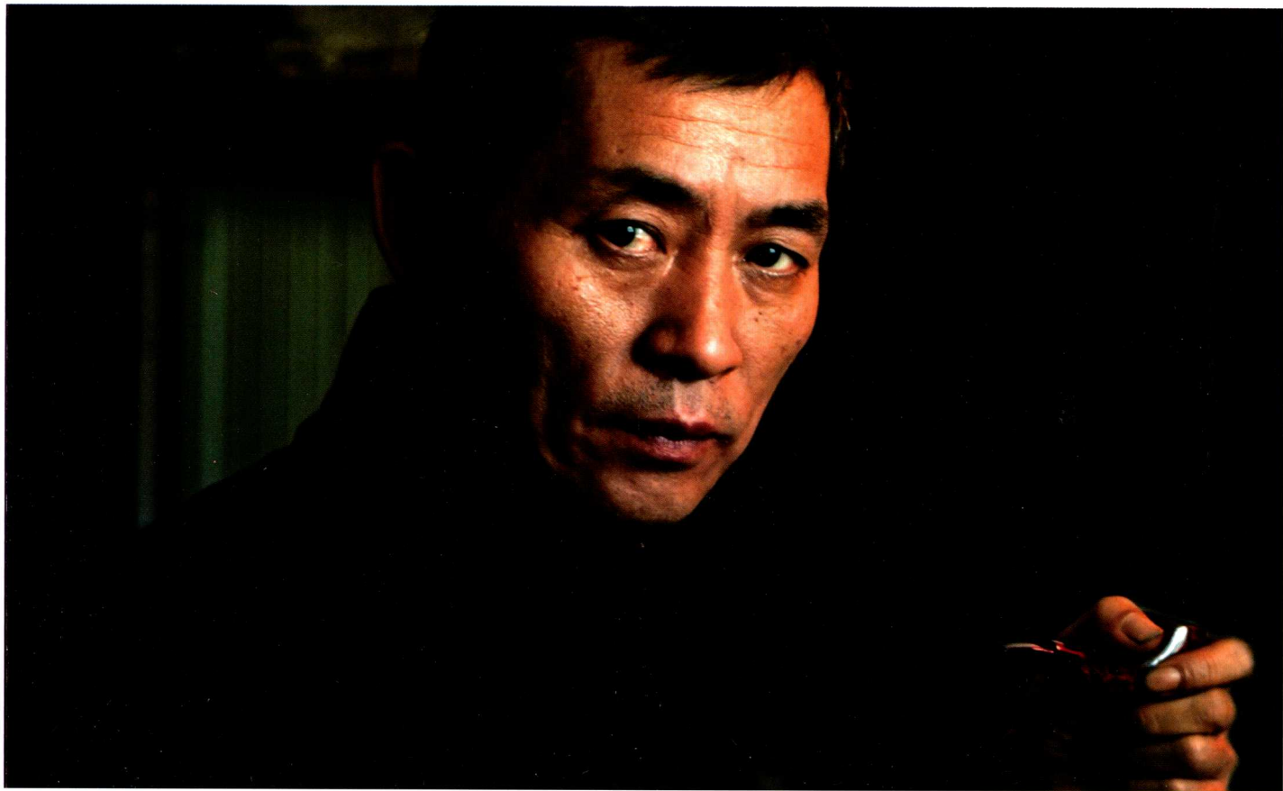
著名人物画家高旭奇近影