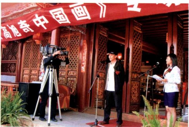
2006年，在昆明举办展览的开幕式上