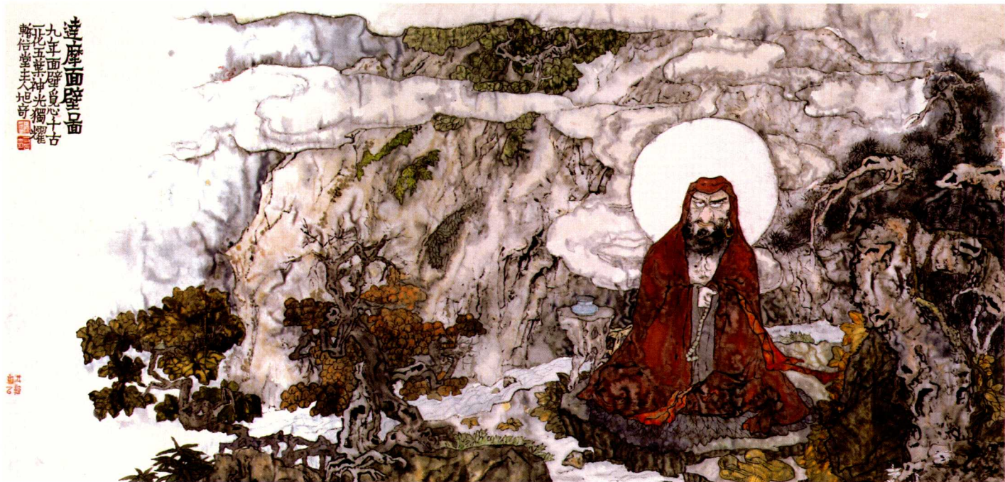
© 神光独耀 2010年 纸本 68cm × 168cm

他作品的最得意之处在于书法的出类拔萃和诗文的华采毕现。他那由魏碑汉隶融入行草笔意而得来的书风，有金农漆书的稚拙凝重，有颜体的雄强端肃，有金石凿字之铿锵有力，也有板桥六分半书的奇巧。虽有隶化、楷化、草化之意，却不失法度之