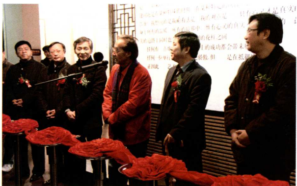
2009年在南昌展览期间，与著名画家宋雨桂先生（右三）、辽宁省博物馆馆长马宝杰先生（右二）在展览开幕式上