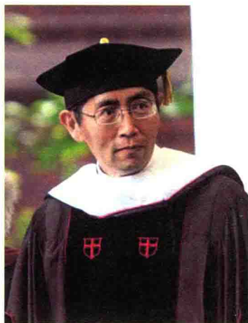
2011 年获布朗大学荣誉文学博士