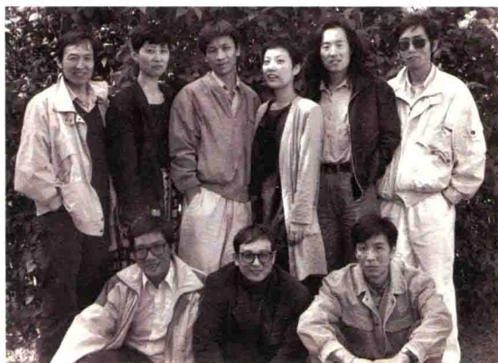
1990年5月和朋友们在挪威奥斯陆