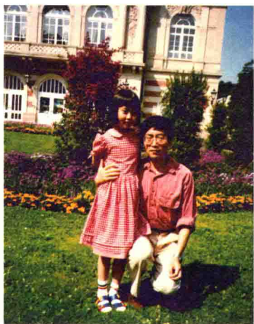
1995 年和女儿田田在法国