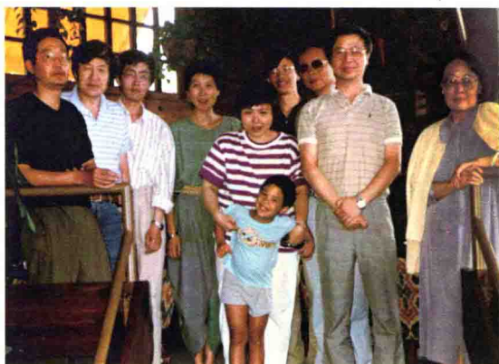
1991年和朋友们在爱荷华