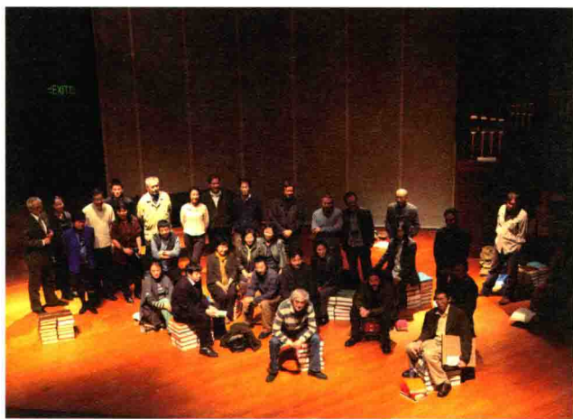
2008年《今天》三十年诗歌音乐晚会（香港中文大学）